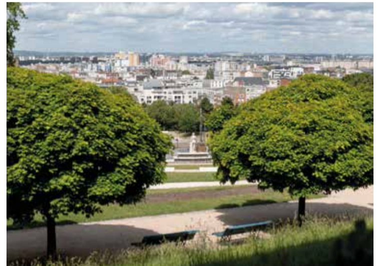
Le parc de la Butte du Chapeau Rouge