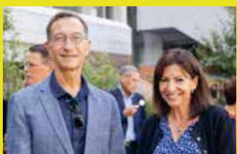
Anne HIDALGO Maire de Paris François DAGNAUD Maire du 19 e arrondissement

Nous sommes à vos côtés pour faire avancer tous ces projets.