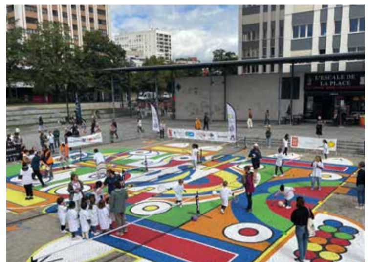
Le « playground » de la place des Fêtes