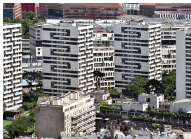
La résidence Michelet