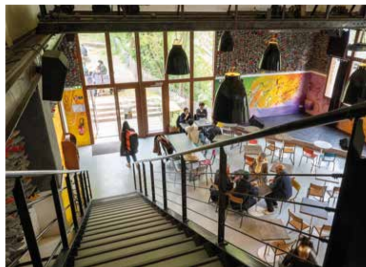
Le TLM