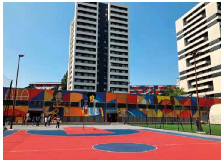
Le terrain de sport Michelet