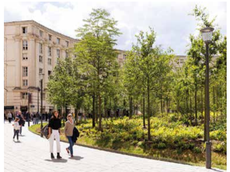
La place de Catalogne