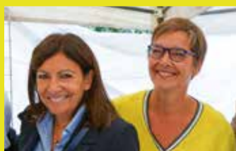
Anne HIDALGO Maire de Paris

Nous sommes à vos côtés pour faire avancer tous ces projets.