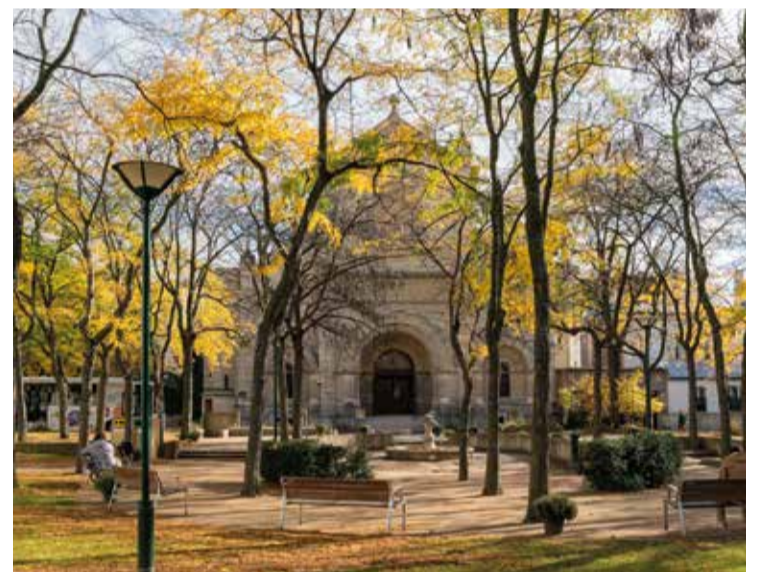
Le square du Cardinal Wyszynski