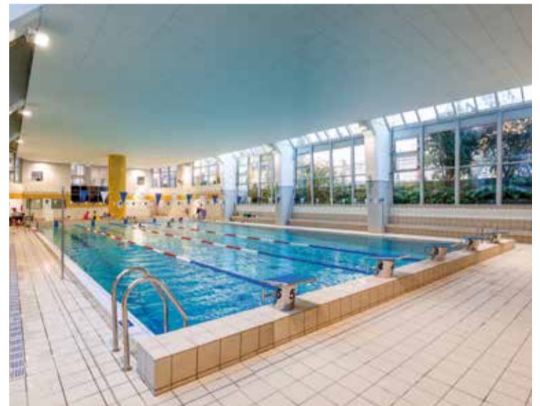
La piscine Mathis – © G. Sanz