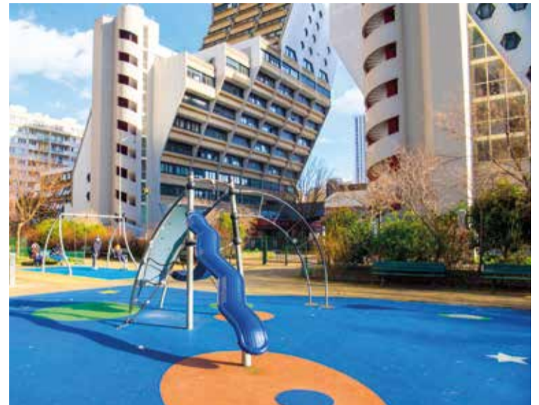
Les Orgues de Flandre

Nous sommes à vos côtés pour faire avancer tous ces projets.