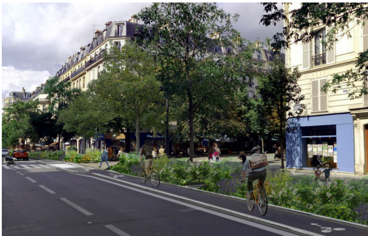
Photomontage du projet

Le détail des impacts par phase est disponible sur le site de la mairie du 11 e .