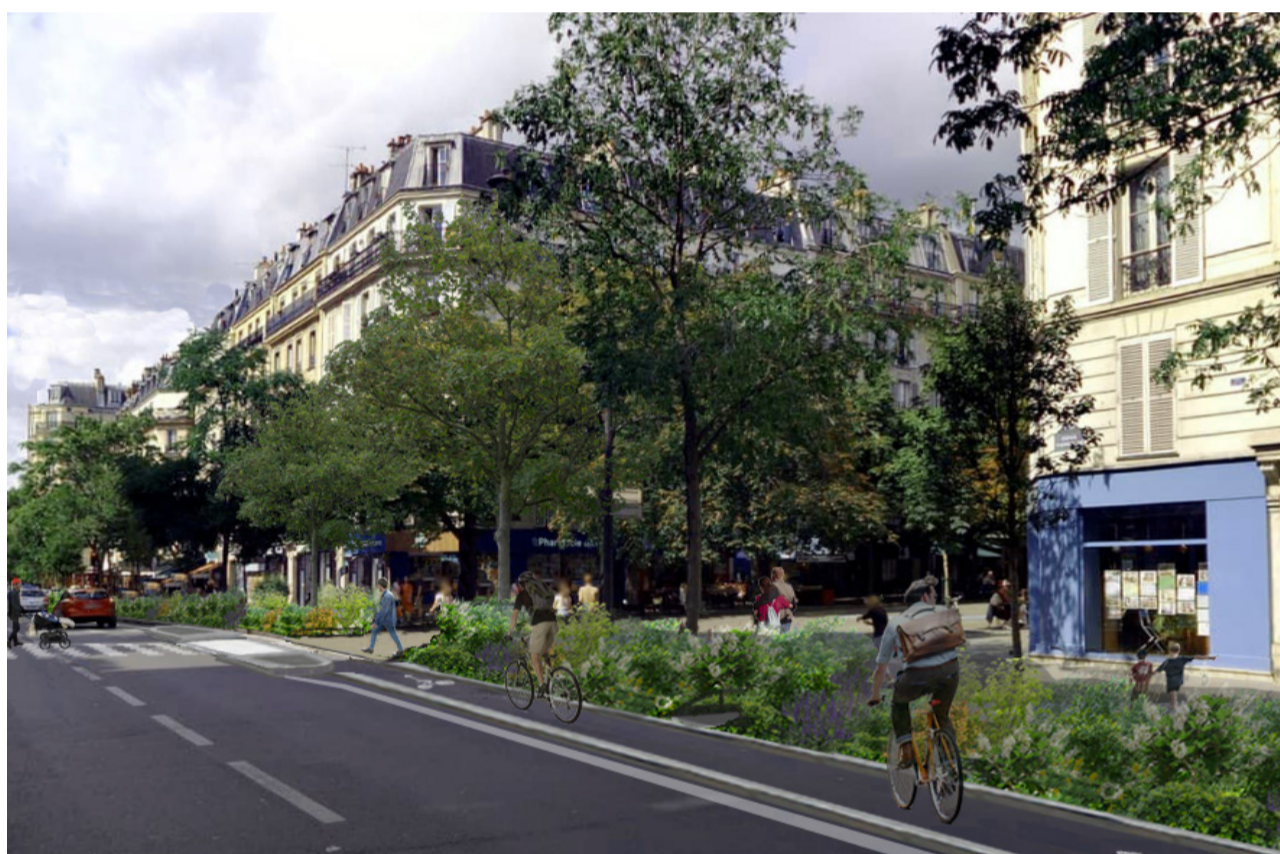
Photomontage du projet