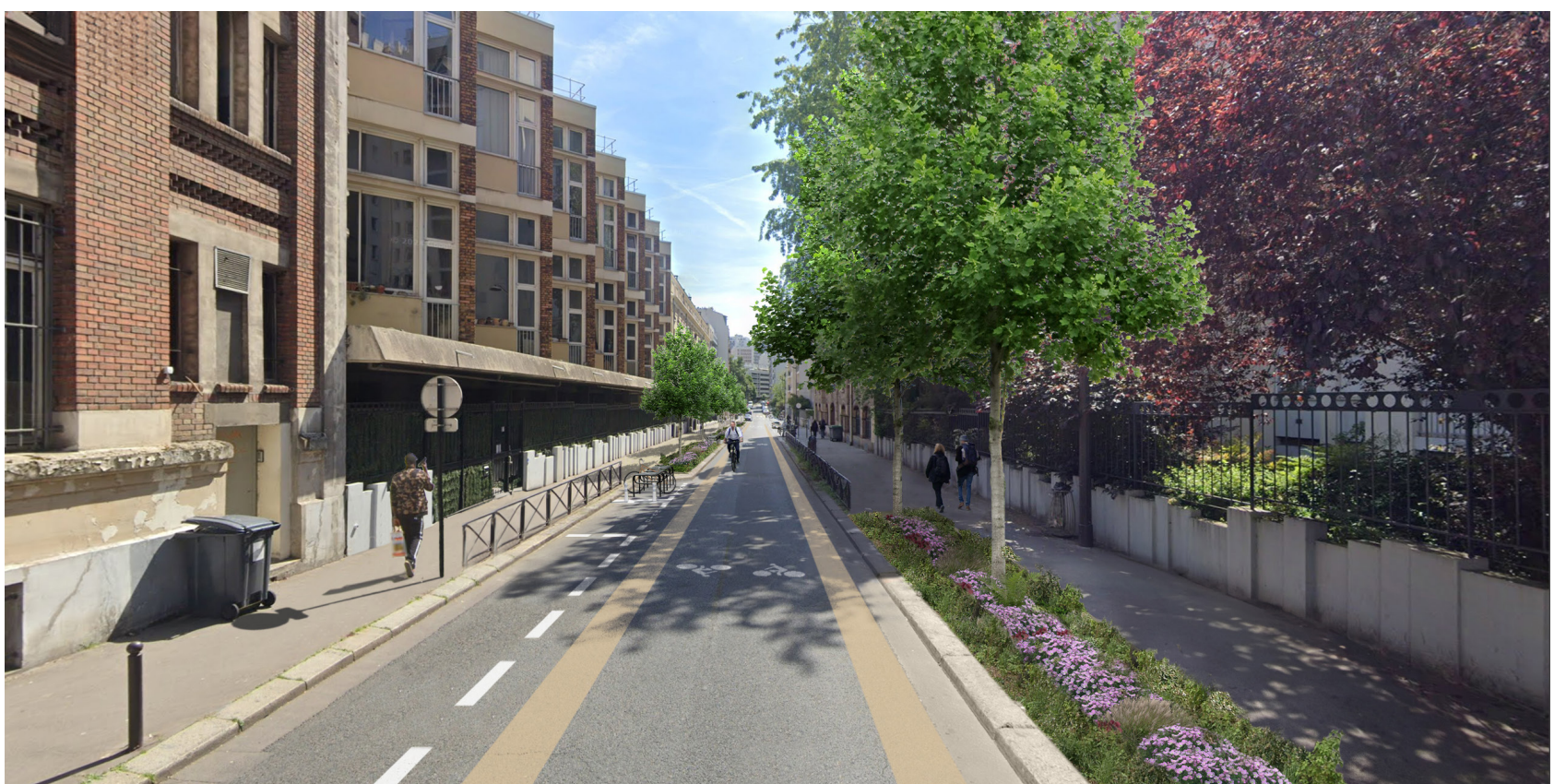
Photomontage | Atelier Nous