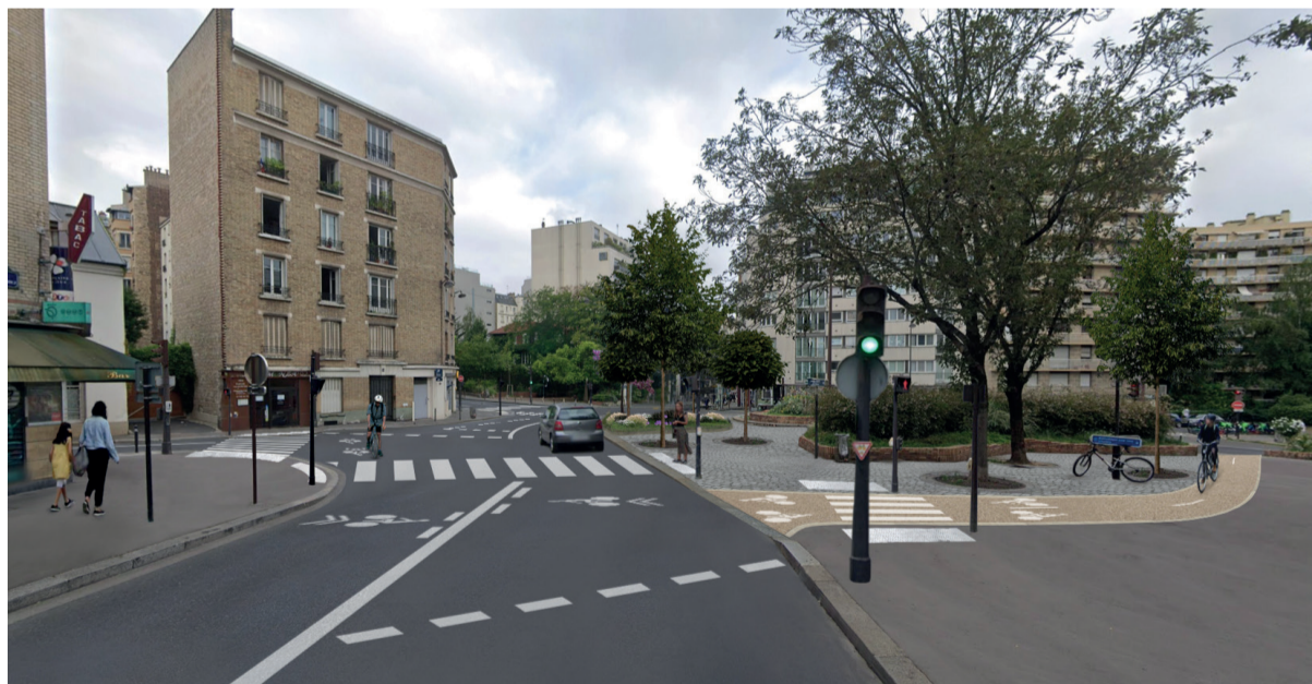
Photomontage de l'état projeté

Phase 1 : extensions des trottoirs en périphérie du carrefour, modification des infrastructures d'assainissement et mise en place de raccords pour les feux tricolores.