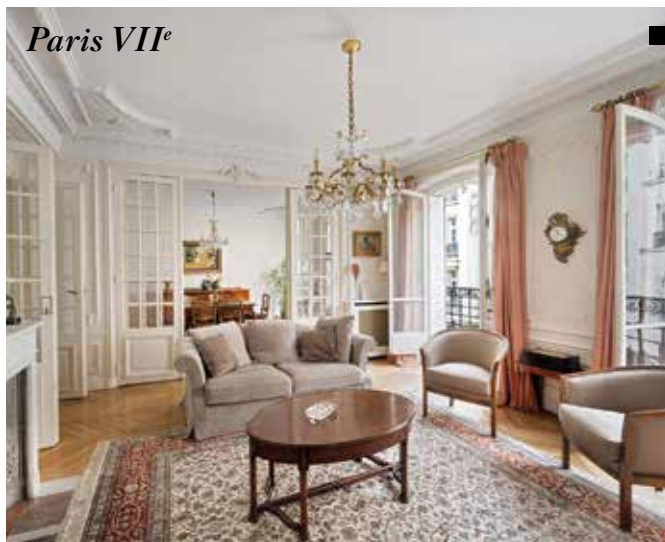
Paris VII e

BELLES ADRESSES À PARIS ET DANS L'OUEST PARISIEN