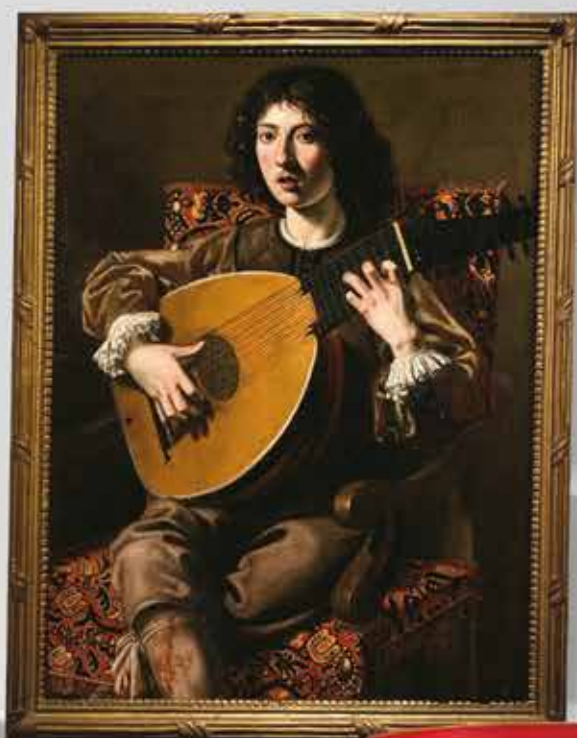
Record du Monde Nicolas TOURNIER "Le joueur de luth" Adjugé 330 000 €