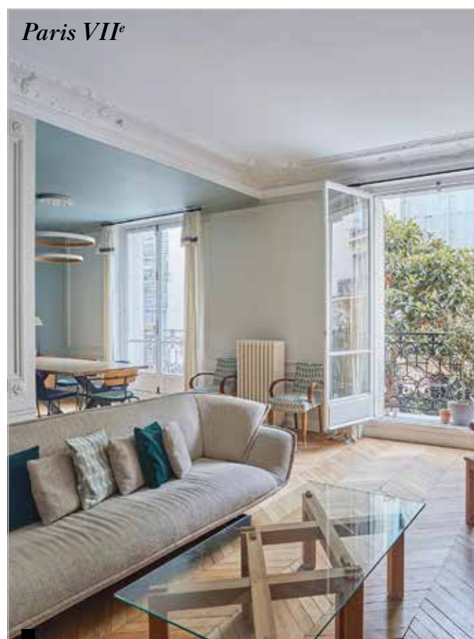
Paris VII e