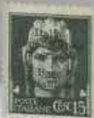
Base navale italienne de Bordeaux n° 2 Adjugé 6 200 €