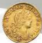
Demi-Louis 1720 Pièce adjugée 9 200 €