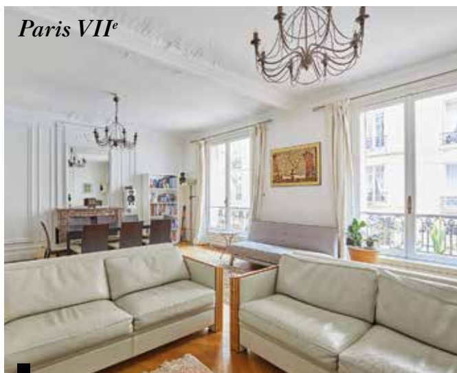
Paris VII e