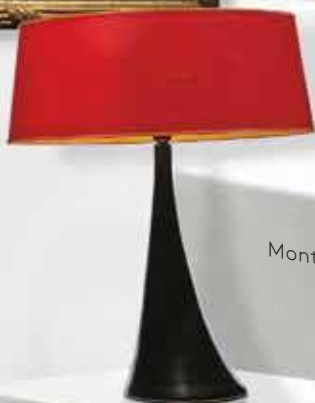
JOUVE Lampe adjugée 84 000 €