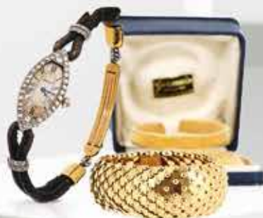
CARTIER Montre adjugée 17 200 €