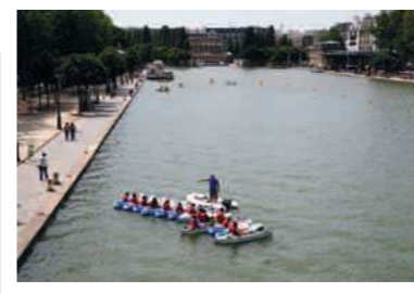
DÉBOUCHÉ EN SEINE (LA BRICHE) SAINT-DENIS