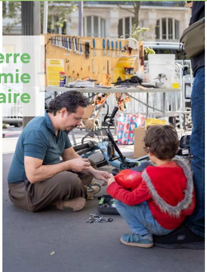
Village Récup' et Répar' du forum des associations