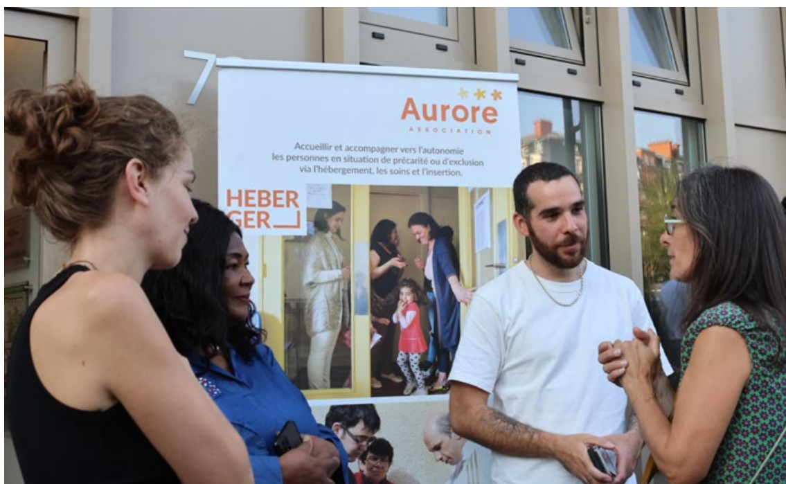
Inauguration de la pension de famille boulevard Poniatowski

Ces pensions de famille incarnent un modèle d'habitat inclusif où solidarité et écologie se rejoignent pour bâtir un avenir plus juste pour tou·tes.