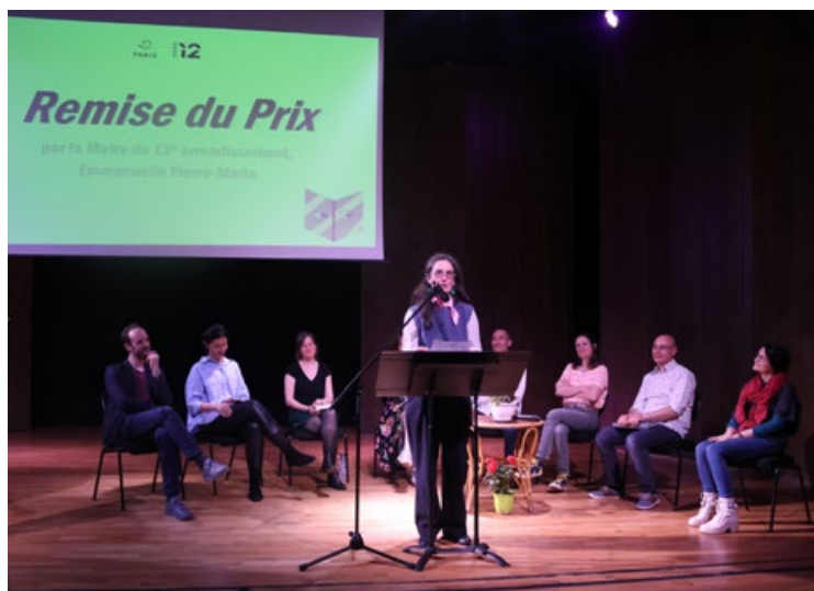
Soirée de remise du Prix du Livre 2024