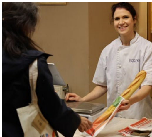
Distribution de violentomètres dans les boulangeries du 12 e

Toute l'année, la maire du 12 e développe un féminisme de proximité, populaire et accessible. Des actions concrètes ont été menées dans les lieux du quotidien : parmi elles, la distribution de sacs à baguettes imprimés du « violentomètre » dans les boulangeries de l'arrondissement, afin de sensibiliser le plus grand nombre aux signes de violences dans les relations affectives. Cet engagement s'est aussi traduit par un accueil soutenu des associations féministes sur le territoire.