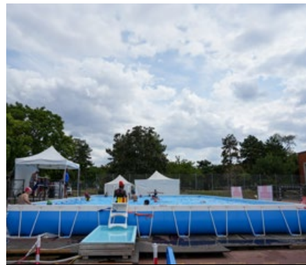
Baignade gratuite à Léo Lagrange

Notre arrondissement comptera un nouvel équipement sportif l'an prochain avec le futur complexe multisports Carnot, dans un quartier de la