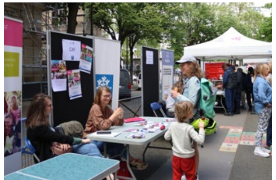
Forum été 2024