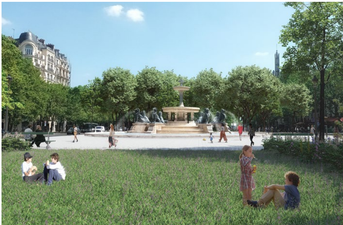
Projection de la place Félix Eboué après travaux

Autre aménagement majeur de la mandature, vous pourrez bientôt profiter de la nouvelle place Félix Eboué. D'ici la fin de l'année 2025, le rond-point dédié à la circulation automobile sera remplacé par une place piétonne et végétalisée, véritable lieu de vie et de passage, aménagé autour de la fontaine aux lions avec des accès piétons sécurisés et de nouvelles pistes cyclables déplacées sur la chaussée.