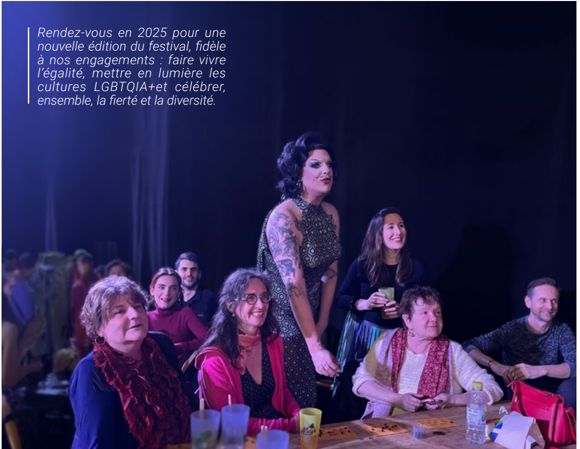
Festival des fiertés

Rendez-vous en 2025 pour une nouvelle édition du festival, fidèle à nos engagements : faire vivre l'égalité, mettre en lumière les cultures LGBTQIA+ et célébrer, ensemble, la fierté et la diversité.