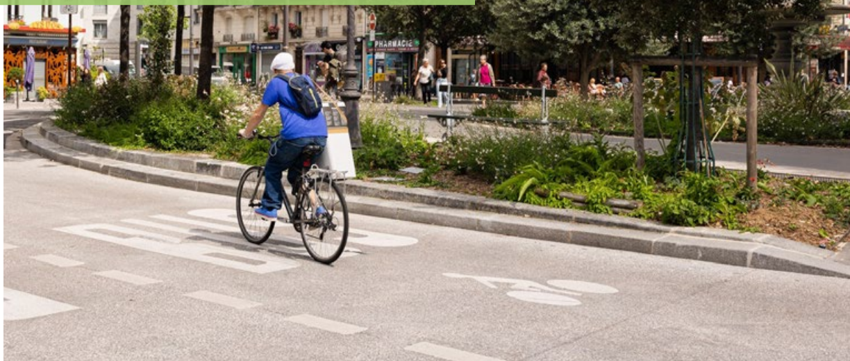
Place du Colonel Bourgoïn

Quand le cadre de vie s'améliore, c'est toute la vie qui change !