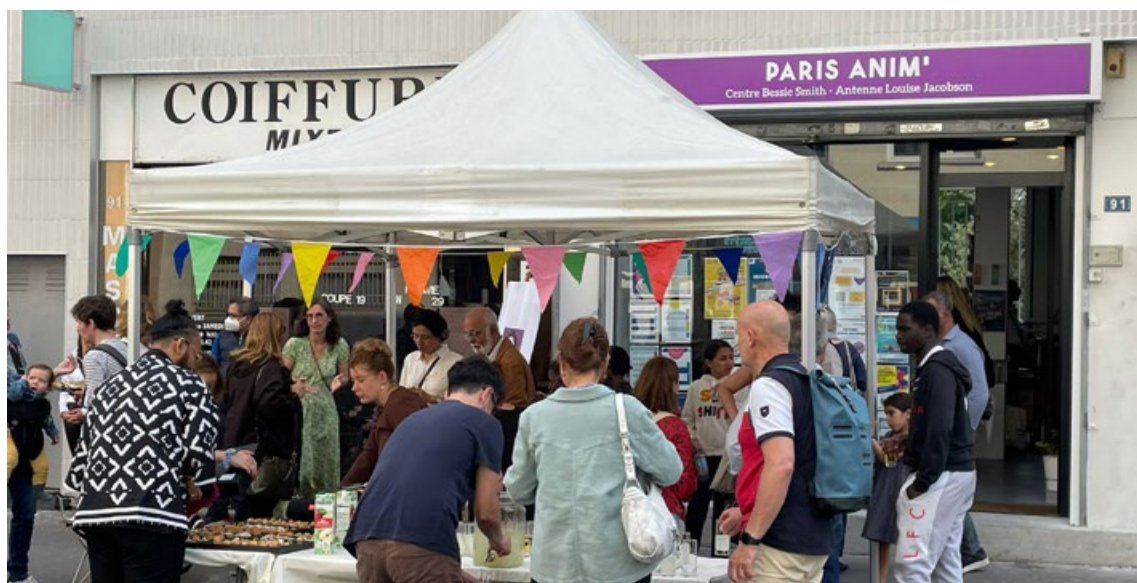
Inauguration de l'antenne du CPA Louise Jacobson

Soutenue par le conseil de quartier Vallée de Fécamp, l'association La Camillienne a pu bénéficier d'un nouvel espace jeunesse rue des Meuniers.