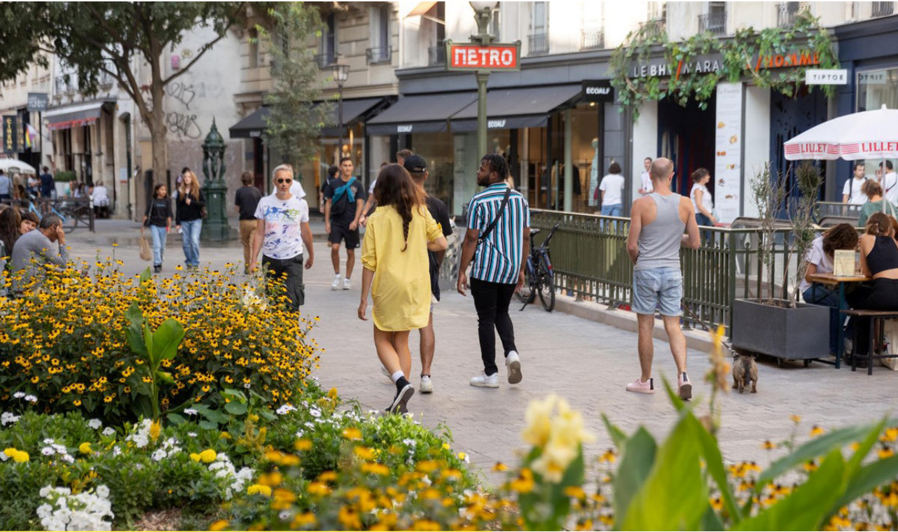
Place Albert-Memmi