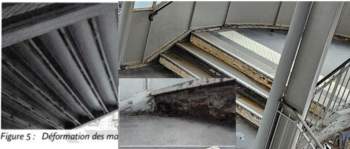
Figure 5 : Déformation des marches et garde-corps

Ces désordres nécessitent de ne pas retarder les travaux pour des raisons sécuritaires