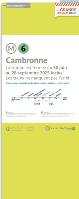
TOTEM IF ET VAL-02, 600 X 1800 MM