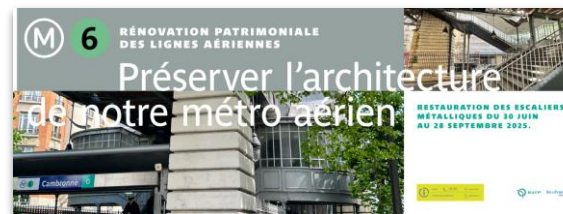
Bâche de valorisation posée sur emprise - 3000x1000mm

Des totems de valorisation et de perturbation sont posés sur les quais, dans les couloirs et aux abords des espaces d'échange.