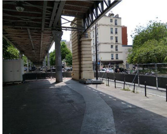
Photos de l'emprise sous le viaduc ligne 6