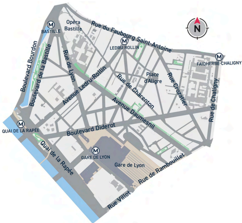
Carte du quartier Aligre Gare de Lyon - Ville de Paris