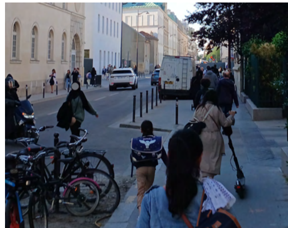
Photographies prises le 20 mai 2025 matin pendant les travaux Emerige – rue de Picpus

Ce phénomène s'est par ailleurs amplifié ces derniers temps en lien avec les évolutions ou mutations du quartier, et alors que la voirie de la rue de Picpus n'a pas fait l'objet d'aménagement. Nous pouvons citer en particulier :