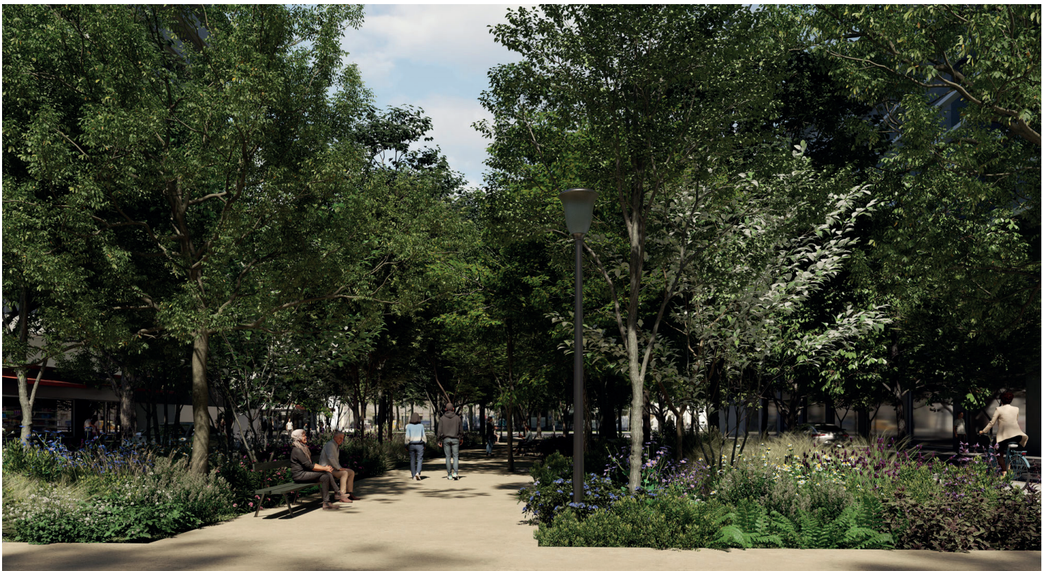
Photomontage du projet