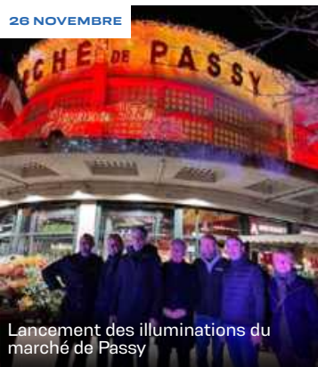
Lancement des illuminations du marché de Passy