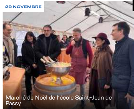
Marché de Noël de l'école Saint-Jean de Passy