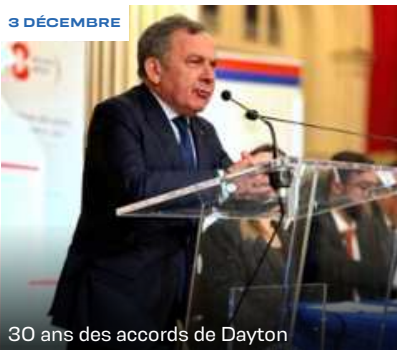
30 ans des accords de Dayton