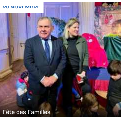
Fête des Familles