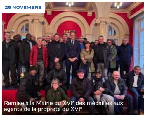
Remise à la Mairie du XVI e des médailles aux agents de la propreté du XVI e