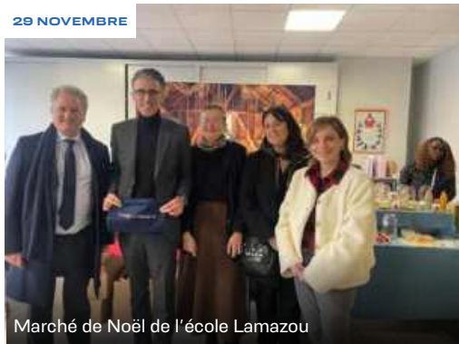
Marché de Noël de l'école Lamazou