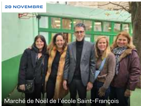
Marché de Noël de l'école Saint-François