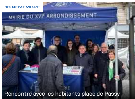
Rencontre avec les habitants place de Passy