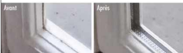
Illustration © 2015 06 74 74 61 03

Contactez NOV-ISOL : 01 40 64 14 30 / 06 74 74 61 03