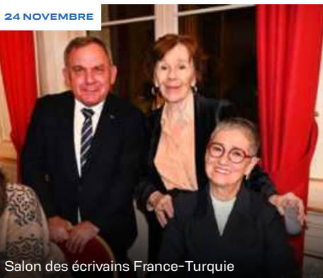
Salon des écrivains France-Turquie