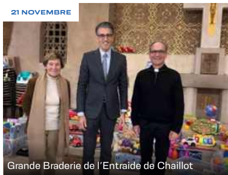
Grande Braderie de l'Entraide de Chaillot