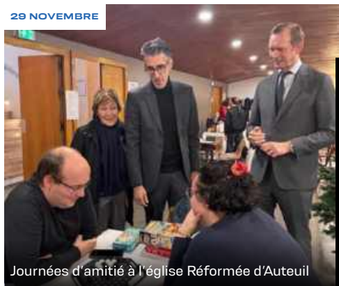
Journées d'amitié à l'église Réformée d'Auteuil