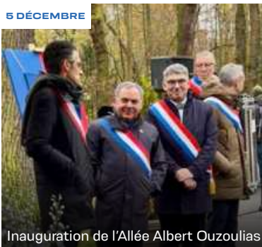
Inauguration de l'Allée Albert Ouzoulias