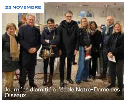
Journées d'amitié à l'école Notre-Dame des Oiseaux