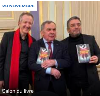
Salon du livre