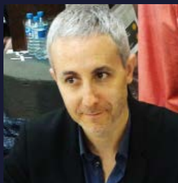
Ivan Jablonka