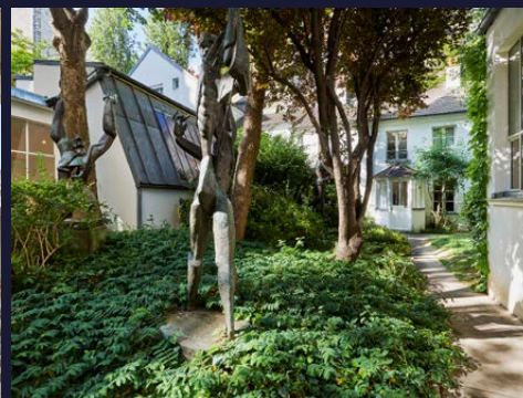
musée Zadkine