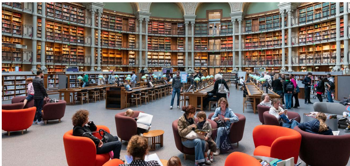
Site Richelieu - BnF