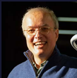
Emmanuel Guibert