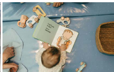
La Maison des Histoires