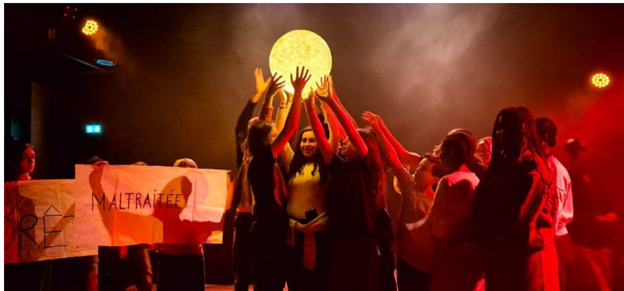
Résidence classique 2024-2025 du Théâtre du Shabano avec les élèves du collège Paul Verlaine (12è)

Sur le temps scolaire et/ou périscolaire ( Action collégiens )