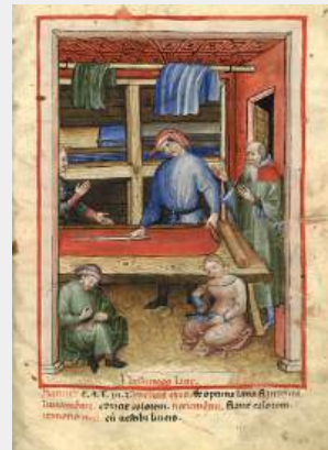
Marchand de vêtements de laine Albucaasis (936-1013). Tacunum sartafis Ibn Butlân. Taqwim es Sîha. BnF