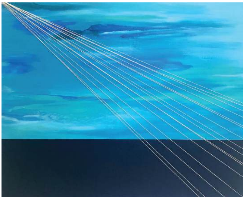
Acrylique et fils de coton sur toile - 81 x 100 cm