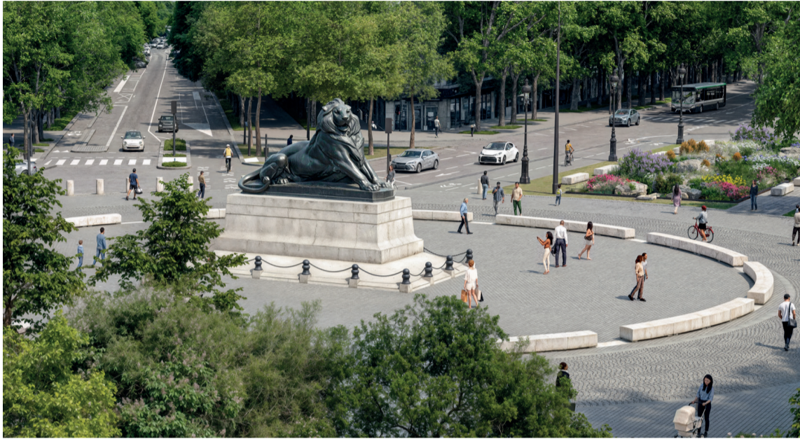
Photomontage du projet