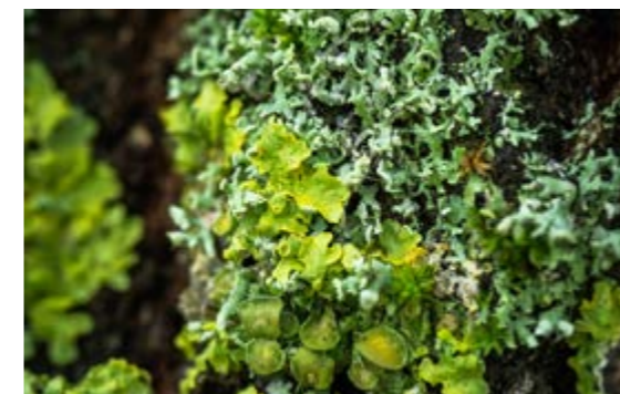
Lichen | Frédéric Combeau

📍 Rdv devant le Parc Floral (plan envoyé une semaine avant)