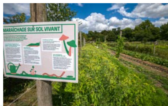
Ferme de Paris | Frédéric Combeau