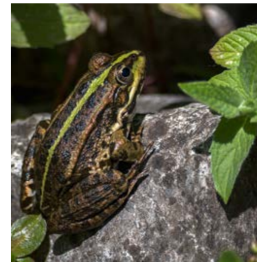
Grenouille rieuse | Frédéric Combeau

📍 Rdv au jardin, 17 rue Saint Vincent (18 e )