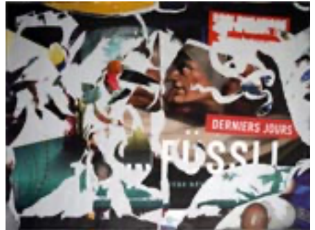
Métagraphie 1 de travail, 2e jour, 2023