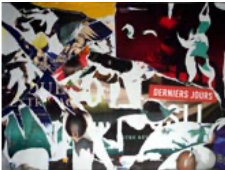
Métagraphie 1 de travail, 3e jour, 2023