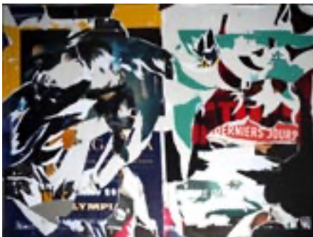
Métagraphie 1 de travail, 5e jour, 2023