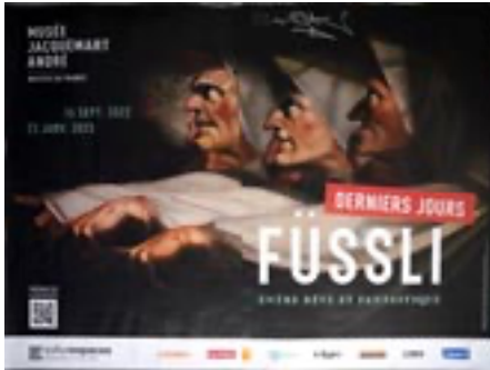
Affiche de l'exposition Füssli, entre rêve et fantastique , au musée Jacquemart André, 2023