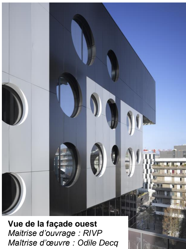
Vue de la façade ouest Maîtrise d'ouvrage : RIVP Maîtrise d'œuvre : Odile Decq

Le Cargo est situé entre la Porte de la Villette et la Porte d'Aubervilliers, au cœur du projet de reconversion des entrepôts Macdonald – construits dans les années 1960 – que la Ville a initié pour régénérer les quartiers s'étendant de part et d'autre du périphérique Est. Il est relié à la Gare Saint-Lazare en moins de 12mn par la ligne E (station Rosa Parks) et au pied du Tramway T3b.