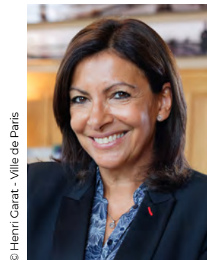
Anne Hidalgo, Maire de Paris