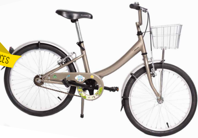
LE 20 POUCES

Ce P'tit Vélib' permet aux enfants de 7 à 8 ans de faire comme les grands.