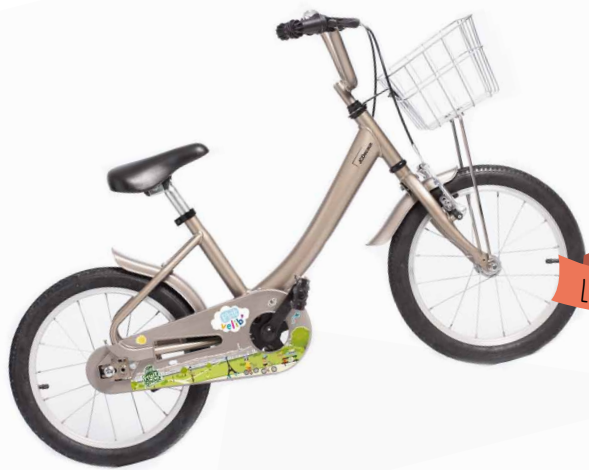
LE 16 POUCES

Equipé ou non de petites roues, ce P'tit Vélib' est adapté à l'apprentissage des enfants de 5 à 7 ans.