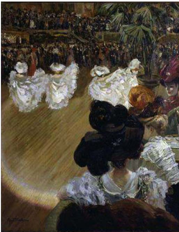
Louis-Abel Truchet (1857-1918), Quadrille du Bal Tabarin, sd, peinture à l'huile sur toile, 81x65 cm, Histoire de Paris-Musée Carnavalet (P.1920)