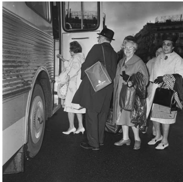
Arrivée de touristes américains à Paris. Photographie, 1963