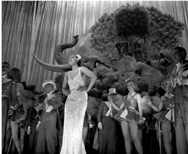
Joséphine Baker (1906-1975), artiste de music-hall américaine, 1937-1938.

Paris est aussi la ville du plaisir et des spectacles. Le Paris du divertissement est le Paris canaille, celui du cabaret, de la Belle Époque aux Années folles (et même pendant l'Occupation), des revues (Moulin Rouge, Crazy Horse ou bals nègres) avec son lot de clichés sur les petites femmes de Paris.