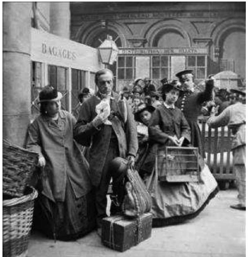
Voyageurs à la gare de Lyon, sous le Second Empire (reconstitution en studio). Paris, vers 1860.

Les changements concernent également le paysage urbain qui se voit modifié dans un sens propice au tourisme : haussmannisation avec des boulevards favorisant la promenade et la sociabilité, multiplication des cafés, aménagement de nouveaux hôtels. Le public qui profite de ces aménagements n'est pas exclusivement composé de touristes mais on vient aussi à Paris pour ces aspects de la ville.