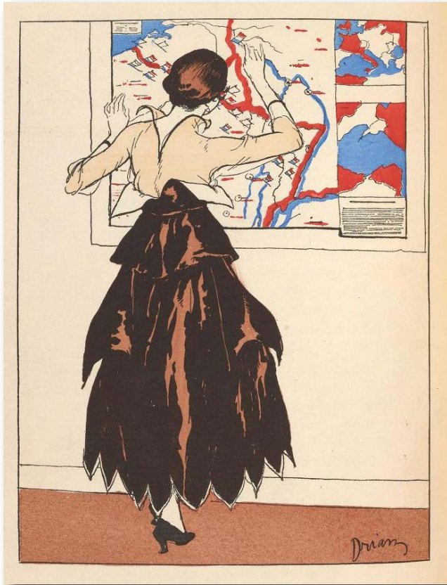
Etienne Drian "En suivant les opérations", Gazette du bon ton, 1915