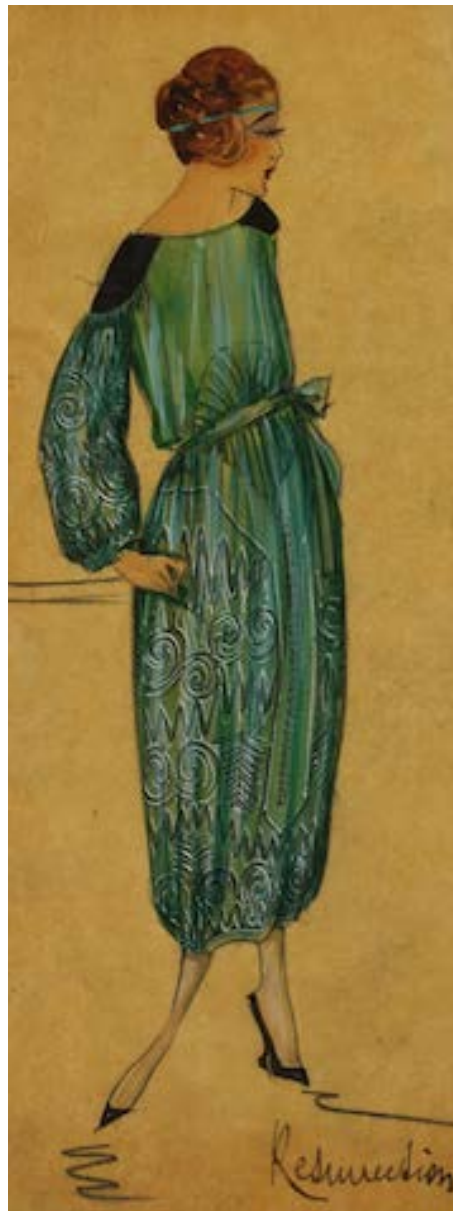
Modèle Résurrection, 1919

Cette première partie aborde la haute couture pendant la guerre en décrivant comment l'éclatement du conflit bouleverse l'industrie de la couture. Elle s'intéresse à l'évolution stylistique des vêtements portés par les femmes de l'aristocratie, de la "crinoline de guerre" à la robe "tonneau". Les robes reflètent aussi l'actualité de la guerre avec leurs couleurs patriotiques et leurs détails militaires. Par ailleurs, en montrant les efforts des couturiers pour défendre le savoir-faire français en matière de mode face à la concurrence étrangère, elle insiste sur la valeur hautement économique, symbolique et patriotique revêtue par la haute couture pendant le conflit.