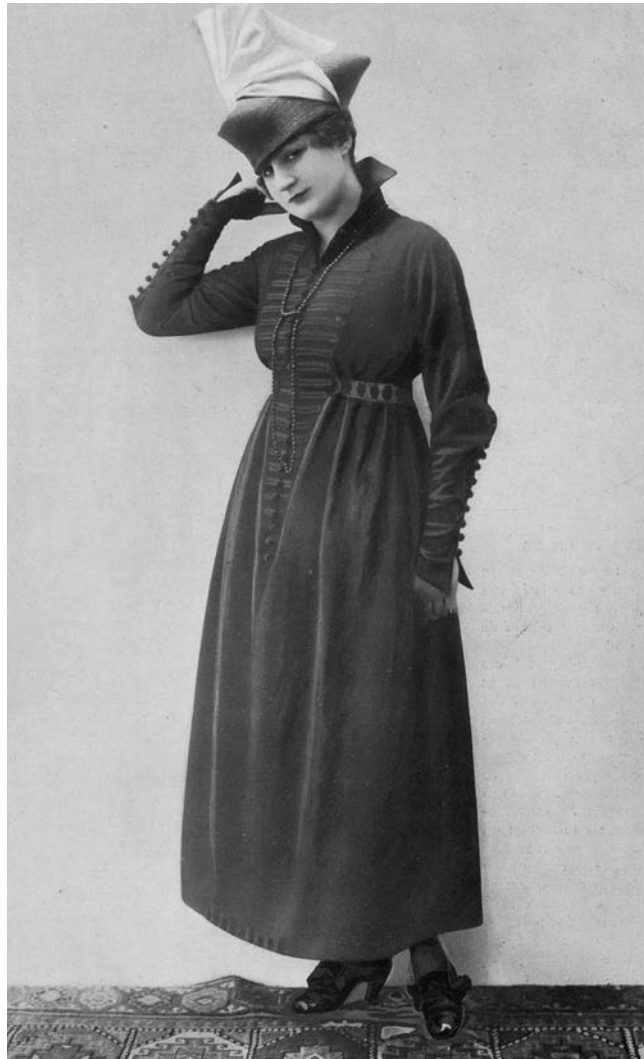
Les Modes , robe "militaire"

Cette partie interroge le rôle des femmes restées à l'arrière qui subissent la guerre au quotidien, en affrontant les drames tout en ayant la responsabilité de leur foyer, et en attendant le retour de leur mari. Elle s'intéresse au deuil, à sa pratique, à sa simplification et aux problèmes que cette dernière pose (deuil « frivole », « veuves joyeuses »). Elle aborde également la question de l'intime, l'image de la femme « rêvée » qui s'oppose à la réalité de la femme active qui continue de suivre la mode. Elle montre à quel point le « problème » de la mode en période de guerre reflète l'angoisse des soldats dans les tranchées : les caricatures sur la mode, omniprésentes dans la presse des tranchées, se retrouvent gravées sur des douilles d'obus comme « souvenirs » de guerre. Cette troisième salle aborde aussi le plus grand mouvement social féminin français jamais vu en France, la grève des minettes en 1917 .