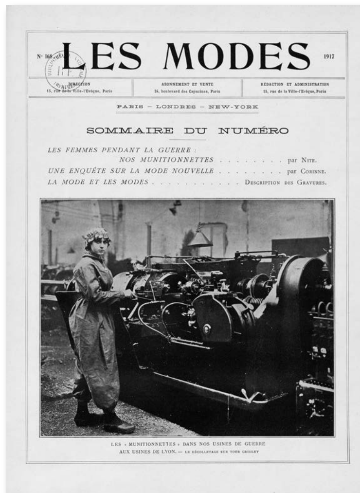
Couverture, Les Modes , 1917

Les femmes qui travaillent pendant la guerre revêtent des tenues ou uniformes pour exercer leurs activités. Elle montre comment le port d'un vêtement spécifique, relié à l'activité exercée, révèle le nouveau statut social de la femme qui remplace son mari à la tête de l'exploitation agricole, se fait engager au sein des usines de munitions, à la Poste comme factrice, ou bien devient conductrice de train... Cette partie dévoile aussi comment le nouveau vêtement quotidien revêtu par les femmes est à l'origine de nombreux débats sur la masculinisation des femmes et sur le brouillage du genre.