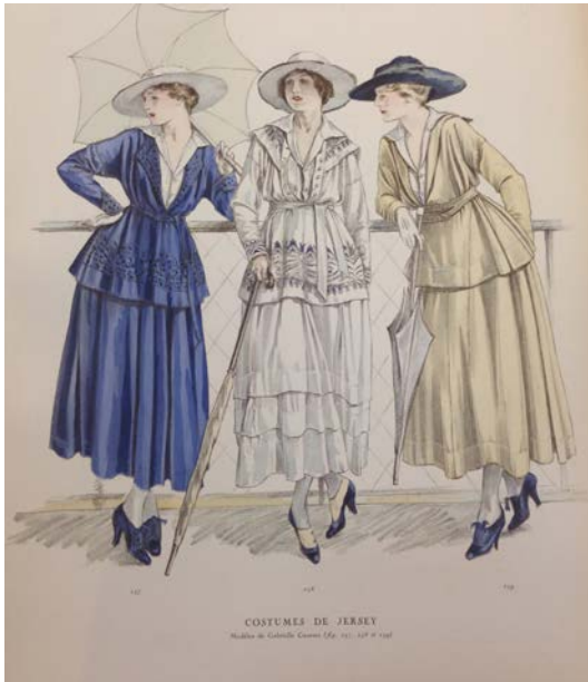
"Costumes de Jersey, Modèles de Gabrielle Chanel", Les Elégances parisiennes , 1916

Les documents et archives sont prêtés par les Archives de Paris , la Bibliothèque historique de la Ville de Paris , la Bibliothèque Marguerite Durand , la Bibliothèque nationale de France , les archives Lanvin , la collection patrimoine de Chanel , le Musée de la Grande Guerre de Meaux , la librairie Diktats , ainsi que par des collectionneurs privés.