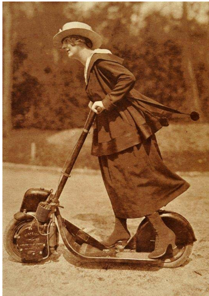
Fémina, 1917

Cette dernière partie accorde une place à la description de la figure de la garçonne, du nouveau rapport au corps induit par la guerre. Elle aborde aussi la question du travail féminin, des droits sociaux et politiques des femmes.