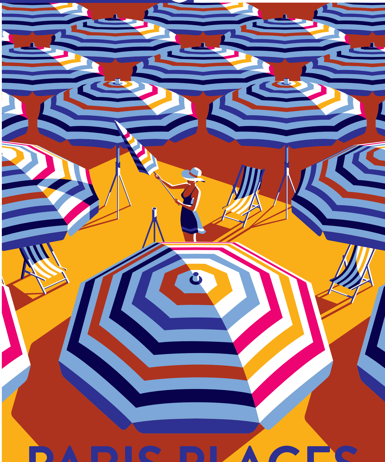
ILLUSTRATION : MALIKA FAVRE / AGENCE TIPHANE ILLUSTRATION X KIBUNDU - GRAPHISME - F. BEAUTRU / MAIRIE DE PARIS