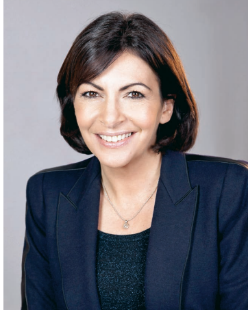
Anne Hidalgo Maire de Paris

Depuis 2001, Paris s'est fortement engagée auprès de ses habitants et de ses visiteurs en situation de handicap. De nombreux citoyens sont concernés : avec plus de 40 000 situations individuelles analysées par an, l'activité de la MDPH en atteste. On dénombre ainsi 26 600 Parisiens bénéficiaires de l'Allocation aux adultes handicapés, 5 000 de la Prestation de compensation du handicap et 2 700 de l'Allocation compensatrice tierce personne. À chacun d'entre eux, leur famille et leurs aidants, nous devons apporter des réponses adaptées et plurielles.