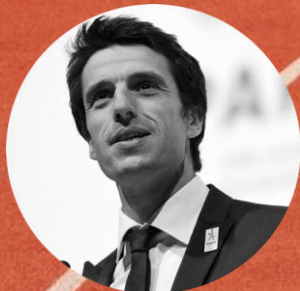
Tony ESTANGUET Co-président du Comité Paris 2024, Triple champion olympique