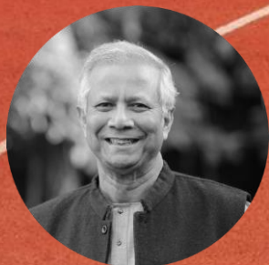
Muhammad YUNUS Prix Nobel de la Paix