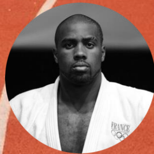
Teddy RINER Co-président du Comité des Athlètes Paris 2024, Double champion olympique