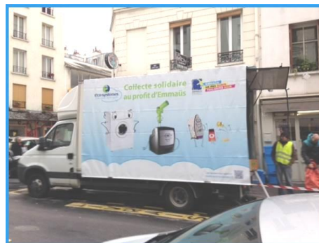
Le camion de collecte solidaire d'Emmaüs Défi récupère les jouets, le mobilier, l'électroménager... pour les revendre dans ses bric-à-brac parisiens. En 2015, les camions passeront dans tous les arrondissements de Paris.

Elle s'investit également pour favoriser le réemploi, notamment dans le domaine du textile . Plus de 240 conteneurs de récupération des textiles sont installés dans l'espace public parisien. Gérés par Le Relais et Ecotextiles, ces conteneurs ont permis en 2014 de collecter 2.750 tonnes de textiles, linges de maison et chaussures dont la majorité a pu être réutilisés (60%) ou alors recyclée (35%). 30 nouveaux conteneurs seront bientôt créés pour rapprocher davantage encore les Parisien du geste de recyclage.