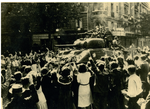
Char du 12 e arrondissement.