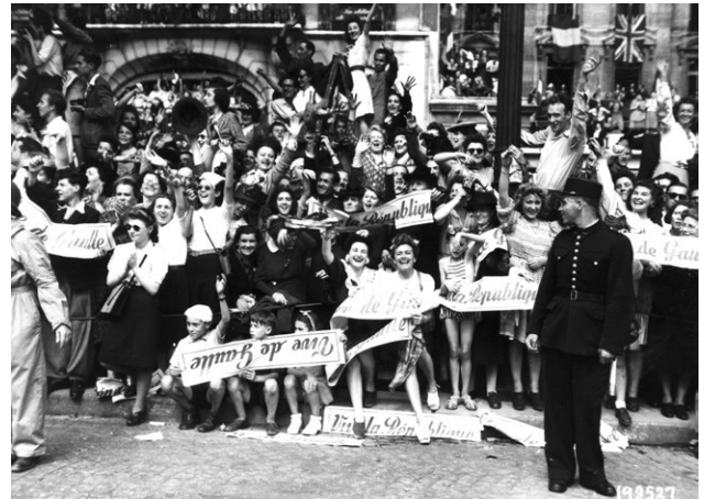
Le 26 Août, le peuple de Paris rend hommage au général de Gaulle.