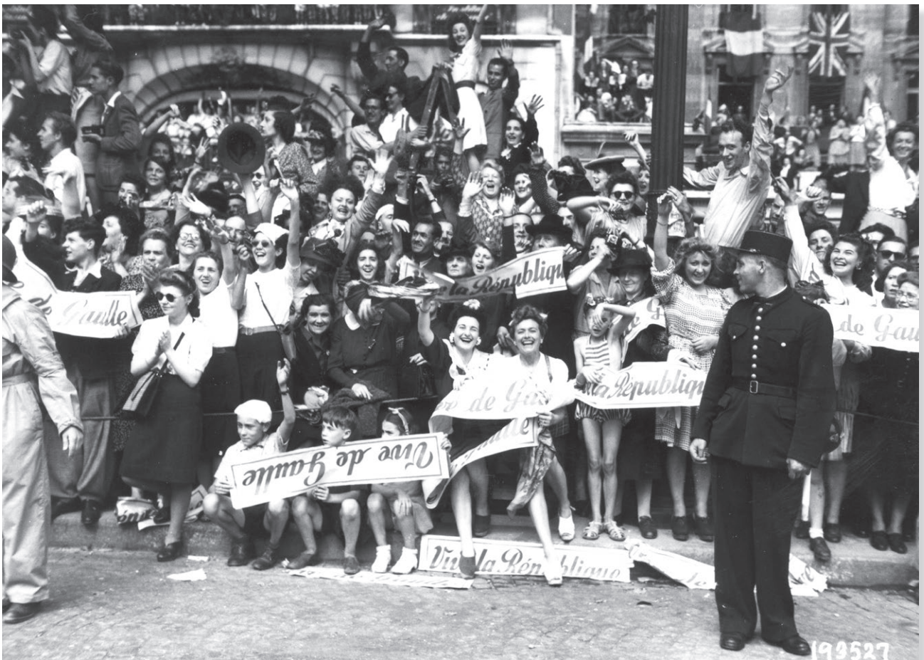
Le 26 août 1944 sur les Champs-Élysées le peuple de Paris rend hommage au général de Gaulle, l'homme du 18 Juin.