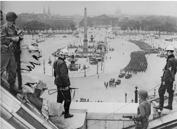
Sapeurs-pompiers et soldats américains surveillant la parade américaine depuis le toit de l'Hôtel de Crillon.