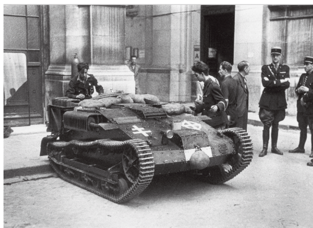
Petit char Renault pris par les FFI de l'Hôtel de Ville aux Allemands. Les résistants y ont apposé la croix de Lorraine, symbole de la France Libre et de la Résistance.