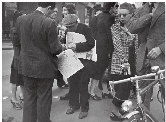
Vente d'un journal de la Résistance. Les Parisiens retrouvent les habitudes du monde libre : lecture d'un journal indiquant l'arrivée du général de Gaulle à Cherbourg, 22 août 1944.

Partenaire de l'exposition, L'AFP illustre ces journées décisives à partir de son fonds historique de dépêches et des photographies de la semaine d'insurrection de la capitale.