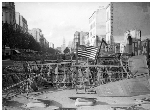
Barricade avenue de la porte d'Orléans.