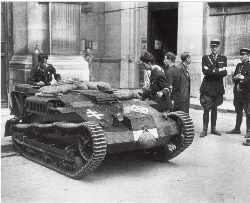
Petit char Renault pris par les FFI de l'Hôtel de Ville aux Allemands

Peu d'expositions d'histoire peuvent être présentées sur les lieux mêmes où se sont déroulés les événements dont elles traitent. De manière exceptionnelle, avec l'exposition « Août 1944, Le combat pour la liberté » l'authenticité des lieux se trouve en totale cohérence avec le récit des faits. 70 ans après la semaine héroïque du 19 au 25 août 1944, l'exposition fait revivre acteurs et moments phares de l'insurrection sur l'un des sites les plus emblématiques du combat, un lieu devenu le symbole de la liberté retrouvée de Paris : l'Hôtel de Ville.