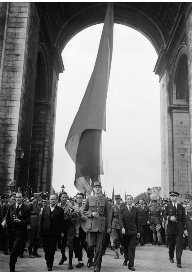
Le général De Gaulle en haut des Champs-Élysées. De Gaulle au départ du défilé est entouré à sa gauche d'Alexandre Parodi, à sa droite, André Le Troquer, commissaire aux territoires libérés ; en arrière-plan, les généraux Leclerc et Juin, 26 août 1944.