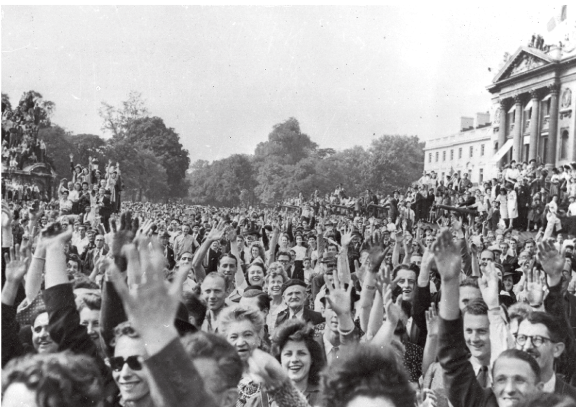
Le peuple de Paris a donné rendez-vous au général de Gaulle, l'homme du 18 juin qui depuis quatre ans a maintenu une France libre et résistante au combat, 26 août 1944.

En écho, un ensemble de témoignages révèle la dimension humaine des combats et la multitude des expériences vécues.