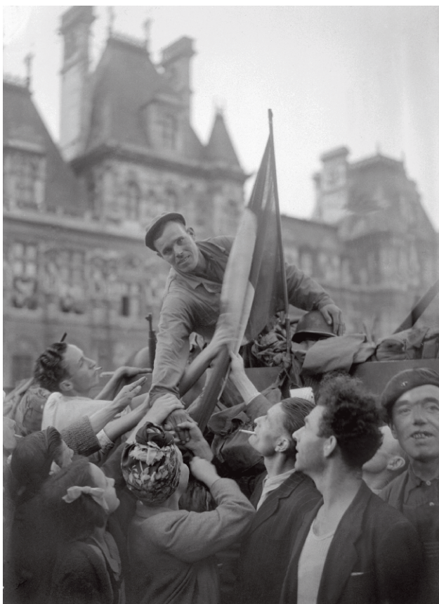
Un soldat de la division Leclerc est acclamé par la foule sur la place de l'Hôtel de Ville, à Paris 26 août 1944.