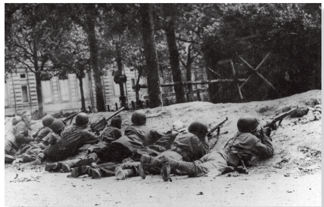
Fantassins du RMT. Des soldats du 2 e bataillon du régiment de marche du Tchad de la division Leclerc en embuscade place de l'Étoile vers l'avenue Kléber, 25 août 1944.