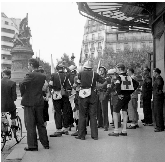
Équipes de secouristes à pied d'œuvre, place Clichy (17 e arrondissement).