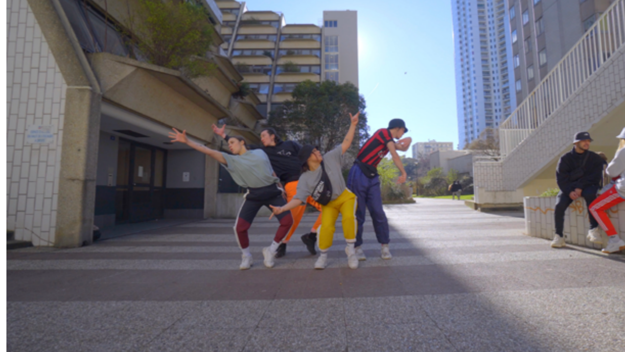
Paris Can Dance Show