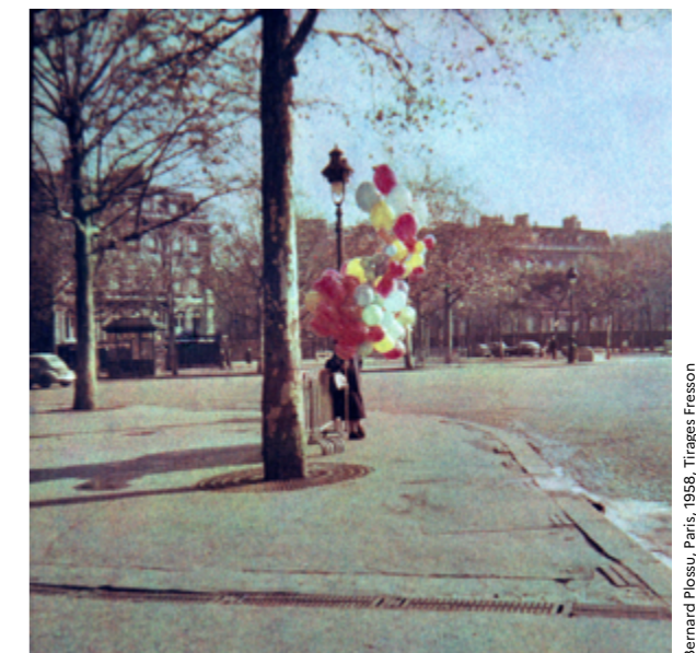
Bernard Plossu, Paris, 1958, Tirages Fresson