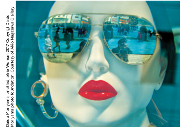
Daido Moriyama, untitled, série Woman 2017

Les différents projets exposés se démarquent avant tout par des esthétiques variées ainsi que des thématiques fortes et engagées comme la dénaturation du littoral, la décolonisation ou encore la mise en valeur du sport féminin.