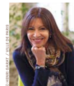
Anne HIDALGO Maire de Paris

Accélérer l'investissement pour prendre notre avenir en main.