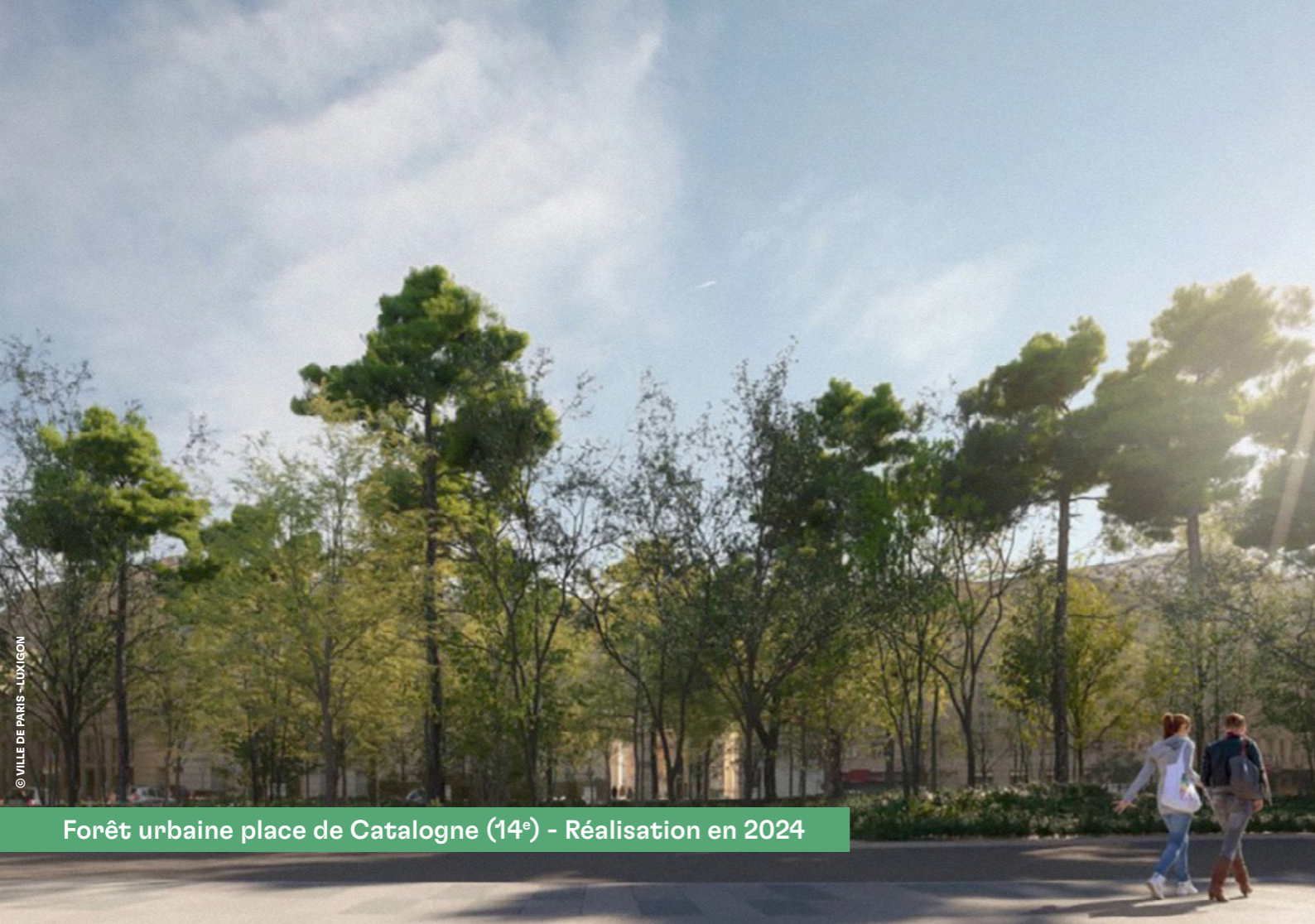
Forêt urbaine place de Catalogne (14 e ) - Réalisation en 2024