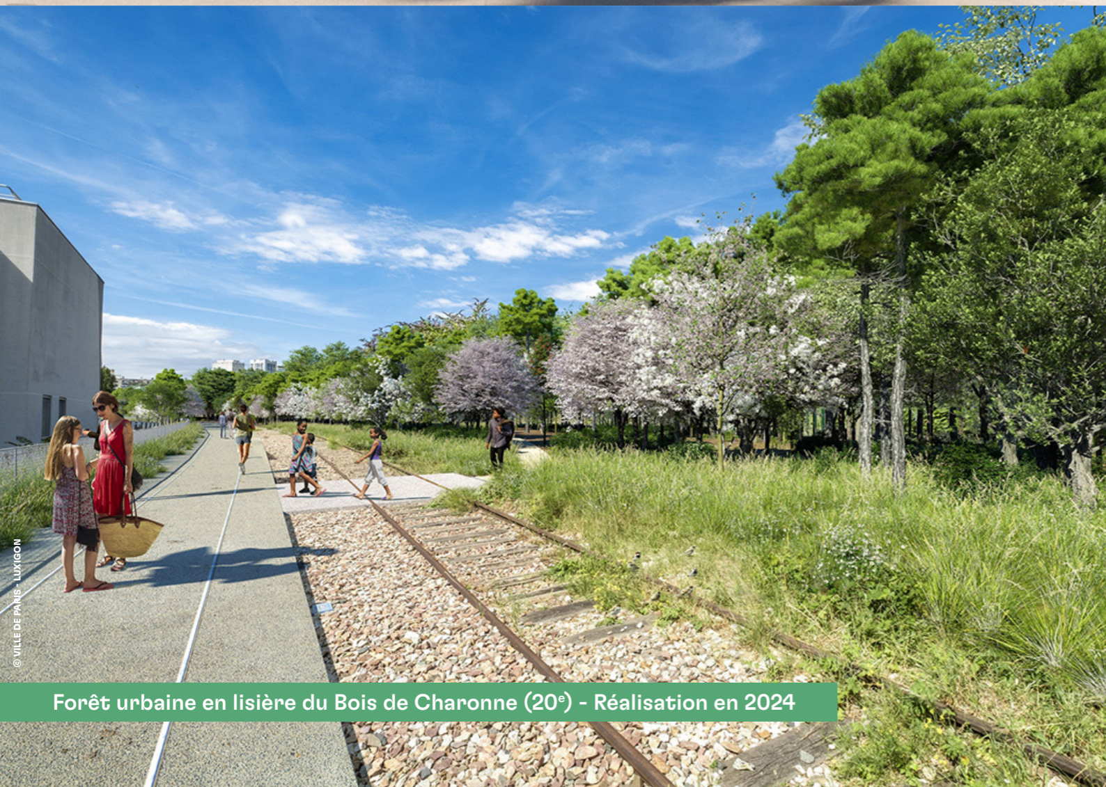
Forêt urbaine en lisière du Bois de Charonne (20 e ) - Réalisation en 2024