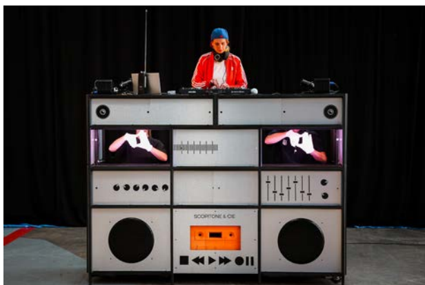
Théâtre d'objet et street dance à la Canopée