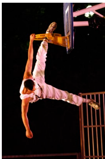
Gymnophonies © P. Bowyer

Rebond de la balle sur la raquette, choc d'un corps qui chute, rythme des pas de l'adversaire : les sons sont indispensables aux athlètes et se fient à eux pour contrôler leurs mouvements, tout comme les musiciens dans leur geste musical ! Le gymnase devient à la fois la scène, le décor et l'instrument d'une symphonie jouée en direct à partir des sonorités du lieu où se mêle geste sportif, geste chorégraphique et geste instrumental. La saison Art'R met en lumière le travail original et le savoir-faire unique de la compagnie Décor Sonore à travers la création d'un spectacle musical à partir et au sein d'un équipement sportif. La performance Gymnophonies se déploie en deux temps : un temps de résidence et de recherche afin de révéler les sonorités du lieu, puis un temps de mise en scène afin d'aboutir à une création musicale théâtralisée destinée à un public de 600 personnes. Durant la résidence de création, la compagnie s'associera à des sportifs amateurs pour contribuer à l'écriture du spectacle.