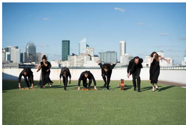
Marathon du concerto

Retrouvez toute la programmation du Festival Formes Olympiques sur paris.fr/ffo .