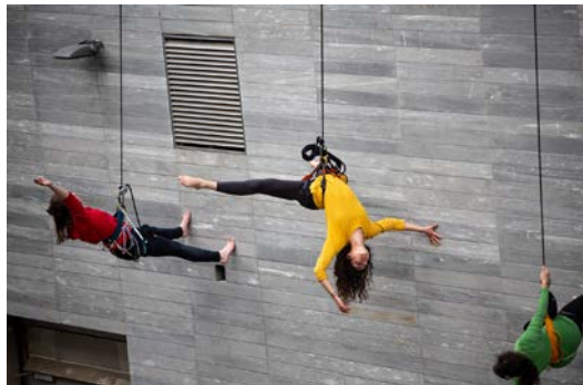
Cet été faites votre cirque !

Avec une série d'ateliers de d'escalade, d'acrobatie, de Hip-hop et de cirque, « Deux pas de côté » propose de mettre en avant les disciplines de la danse verticale, de l'escalade et de l'acrobatie, à la croisée des arts et du sport afin d'interroger petits et grands sur la notion de la prise de risque. Les arts du cirque et du mouvement s'appuient depuis toujours sur une formation technique formelle, des gestes et des codes communs au sport : élans, sauts, déplacements de groupe, regards, écoute, performance du corps et du mental.