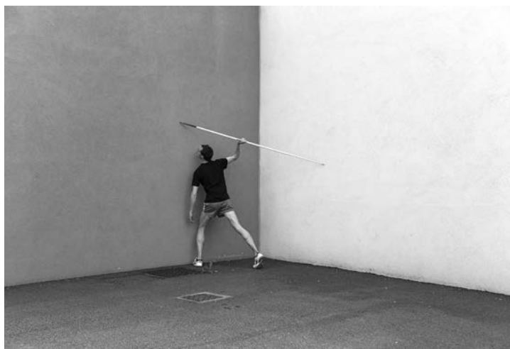
Super Pixel © Le javelot, 2014, Antoine Martial

Le Paris Université Club et le Jeu de Paume s'associent pour lancer à l'échelle de l'Île-de-France, en partenariat avec la Fédération Française des Clubs Omnisports et Analog Sport, une mission photographique pour bâtir une vision inédite, sensible et populaire du sport amateur portant un regard photographique sur le sport et l'handisport pratiqué au quotidien. Six photographes, de générations et de styles variés, tenteront de relever le défi : Florence At s'intéressera au para athlétisme ; Marvin Bonheur