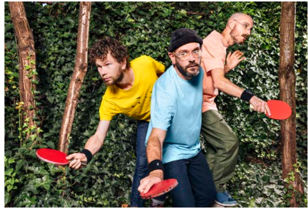
Players & Co