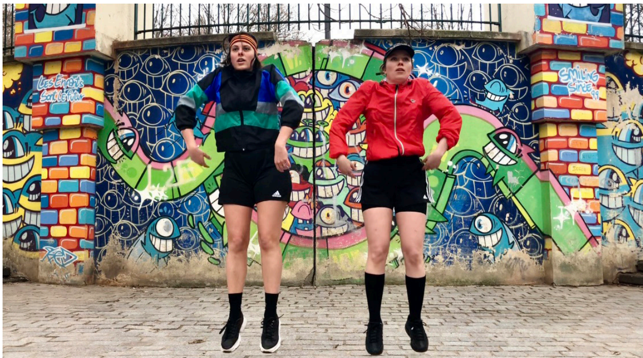
Muscle ton jeu !

Et aussi : Participez à la Gazette Olympique ! (IDES (14 e ) et École de la Goutte d'Or (18 e ), du lundi 26 au vendredi 30 juin 2023) – À vos marques, prêts, écrivez ! (divers lieux, du 24 juin au 15 septembre) – Muscle ton jeu ! Performance et échauffements artistico-sportifs (Jardin Pali Kao (20 e ), du 23 au 25 juin)