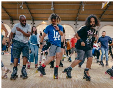
Roller Dance Party

Ludique et immersif, Le Carreau du Temple réinvente la fête sportive et électro en partenariat avec Martine Patine ! L'esplanade de la Canopée se transforme en piste géante de Roller Dance lors d'un après-midi de glisse exceptionnelle, ouvert à tous les niveaux de pratique de roller (enfants comme adultes). Apparue dans les 70's et popularisée dans les 80's, la pratique du roller disco est de retour et ne cesse de faire de nouveaux adeptes. Un rendez-vous clé en main, mélange d'initiations au Roller Dance, de shows, de performances et des meilleurs DJ's du genre, pour un rendez-vous 100% roller et clubbing !