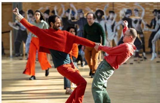
sHommes XY

Dans le cadre du Monfort 2024, le Théâtre du Monfort soutient Kami, Bgirl de haut niveau qui invitera le public à découvrir sa discipline, le breaking, le temps d'une initiation et d'un battle qui prendront place dans le parc Georges Brassens.