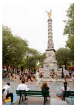
Manifestation culturelle organisée par le Collectif Minuit 12 durant le Festi- val de la Place le 17 septembre 2023, Place du Châtelet, Paris 4 e