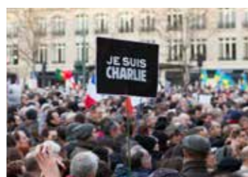
Marche républicaine en hommage aux attentats à Charlie Hebdo, Paris 3 e , 10 e et 11 e , Place de la République