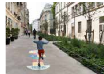
Rue aux écoles, rue du Sommerard, Paris 19 e