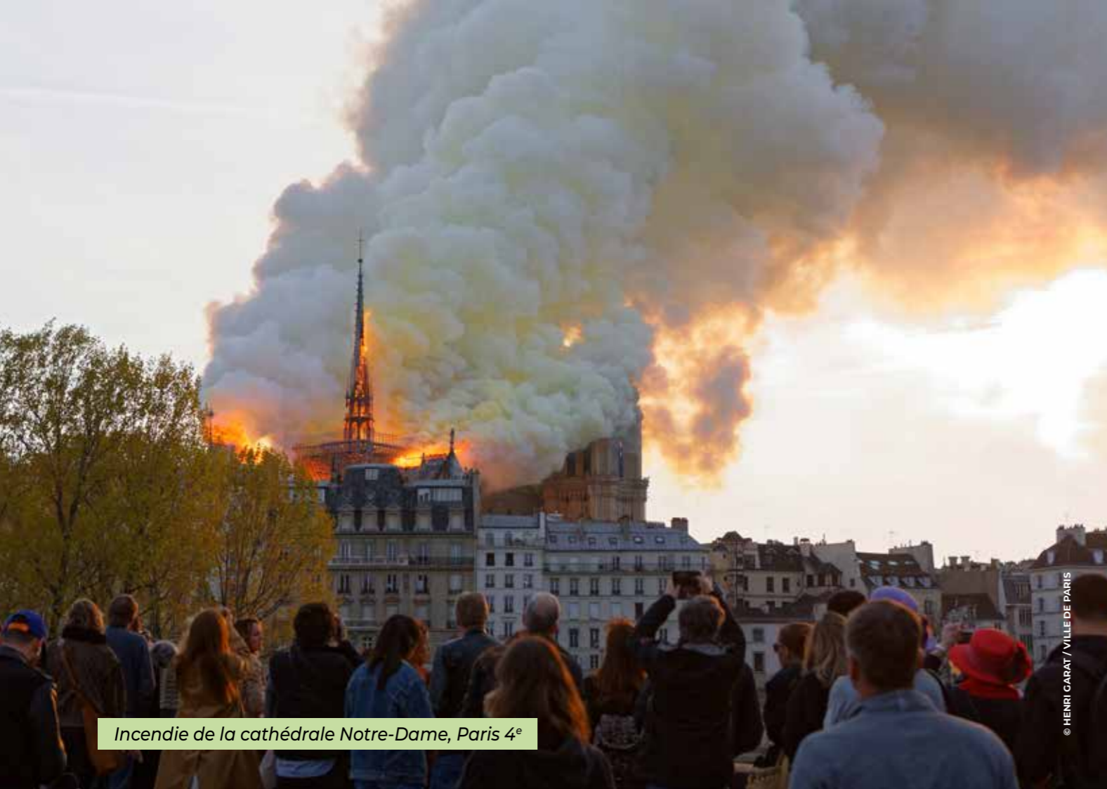
Incendie de la cathédrale Notre-Dame, Paris 4 e