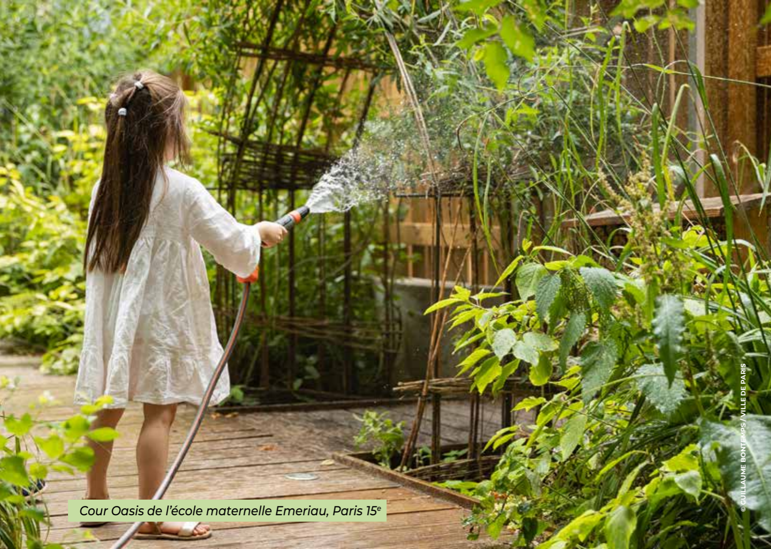
Cour Oasis de l'école maternelle Emeriau, Paris 15 e