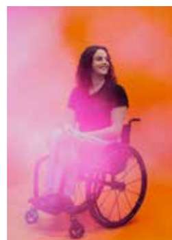
Portrait de Parisienne