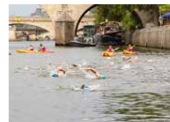
Baignade dans la Seine dans le cadre des tests pour les Jeux olympiques et paralympiques de 2024, Paris 4 e