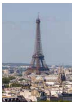
Vue sur la Tour Eiffel depuis la Tour Saint-Jacques, Paris 4 e