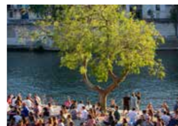
Berges de Seine, Paris 4 e