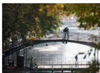
Passerelle Arletty sur le Canal Saint-Martin, Paris 10 e