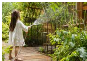
Cour Oasis de l'école maternelle Emeriau, Paris 15 e