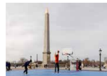
Terrain de basket du Parc urbain La Concorde, Paris 8 e