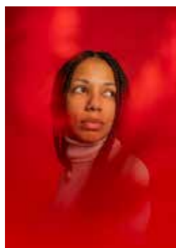
Portrait de Parisienne