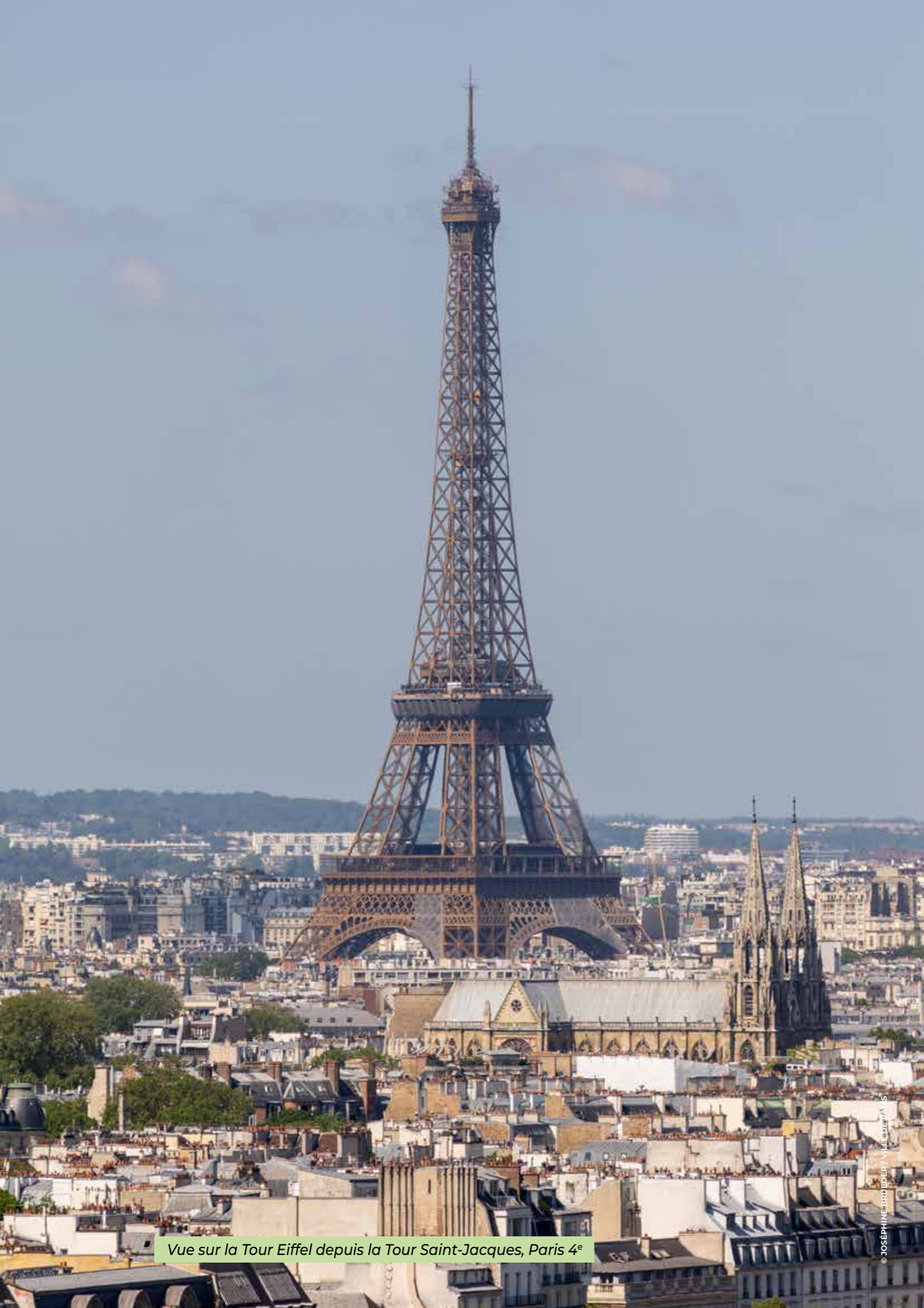
Vue sur la Tour Eiffel depuis la Tour Saint-Jacques, Paris 4 e