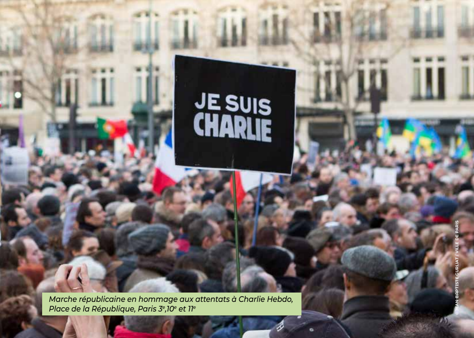
Marche républicaine en hommage aux attentats à Charlie Hebdo, Place de la République, Paris 3 e , 10 e et 11 e