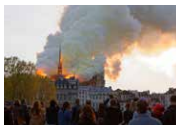
Incendie de la cathédrale Notre-Dame, Paris 4 e