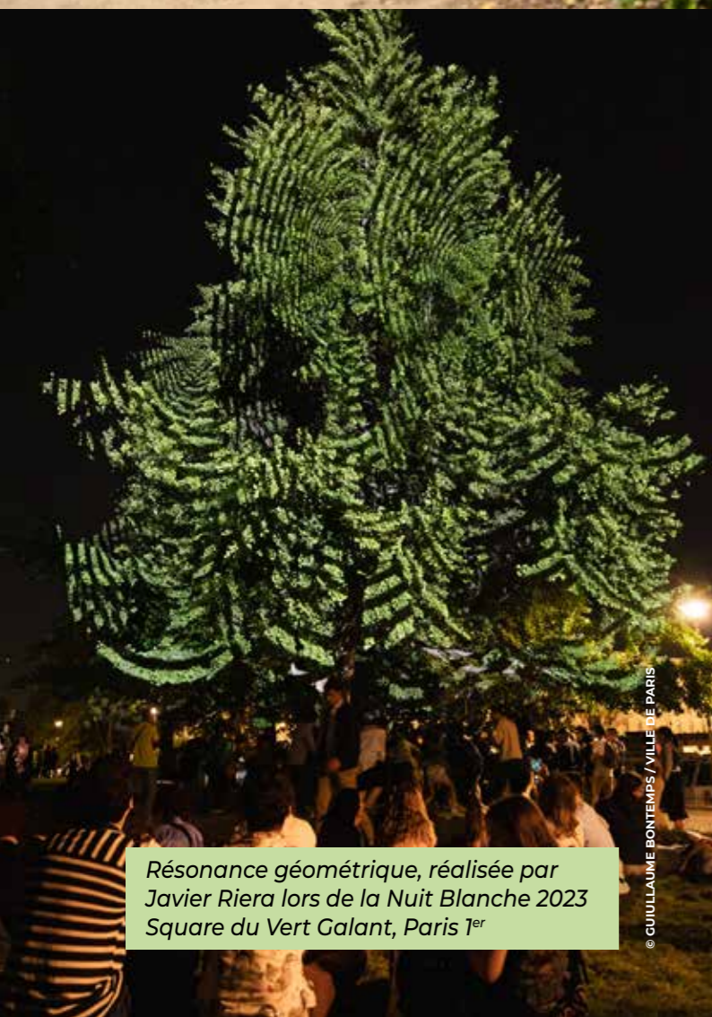
Résonance géométrique, réalisée par Javier Riera lors de la Nuit Blanche 2023 Square du Vert Galant, Paris 1 er