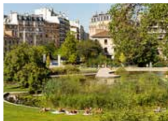
Parc Georges Brassens après son réaménagement, Paris 15 e