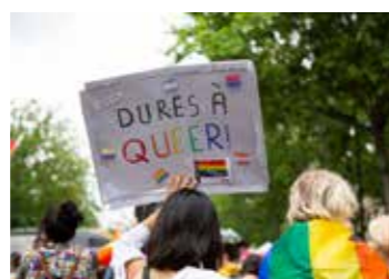
« DURE.S A QUEER! », Marche des Fiertés du 25 juin 2022, Paris 12 e