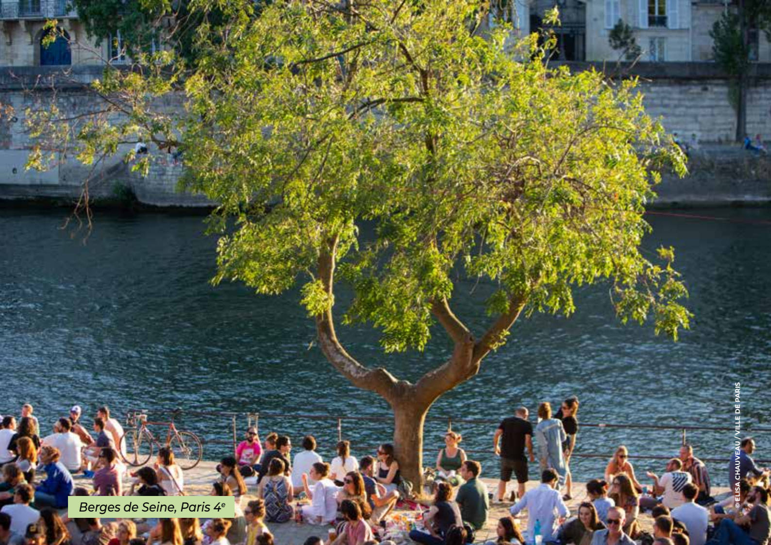
Berges de Seine, Paris 4 e