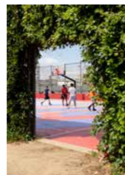
Playground du jardin d'Eole, Jardin d'Eole, Paris 4 e