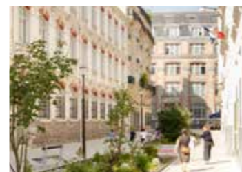
Rue aux écoles, rue Tandou, Paris 19 e