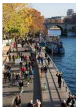
Berges de Seine, rive droite, Paris 4 e