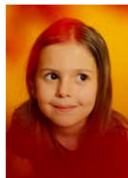
Portrait de Parisienne