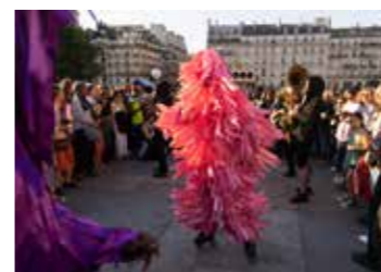
Résonance géométrique, réalisée par Javier Riera lors de la Nuit Blanche du 3 juin 2023, Square du Vert Galant, Paris 1 er