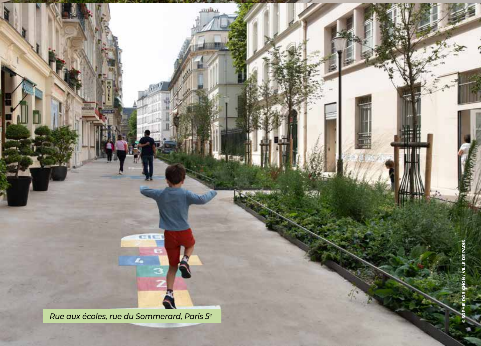
Rue aux écoles, rue du Sommerard, Paris 5 e