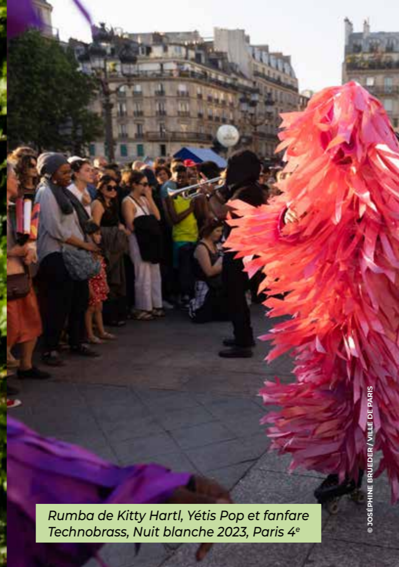
Rumba de Kitty Hartl, Yétis Pop et fanfare Technobrass, Nuit blanche 2023, Paris 4 e