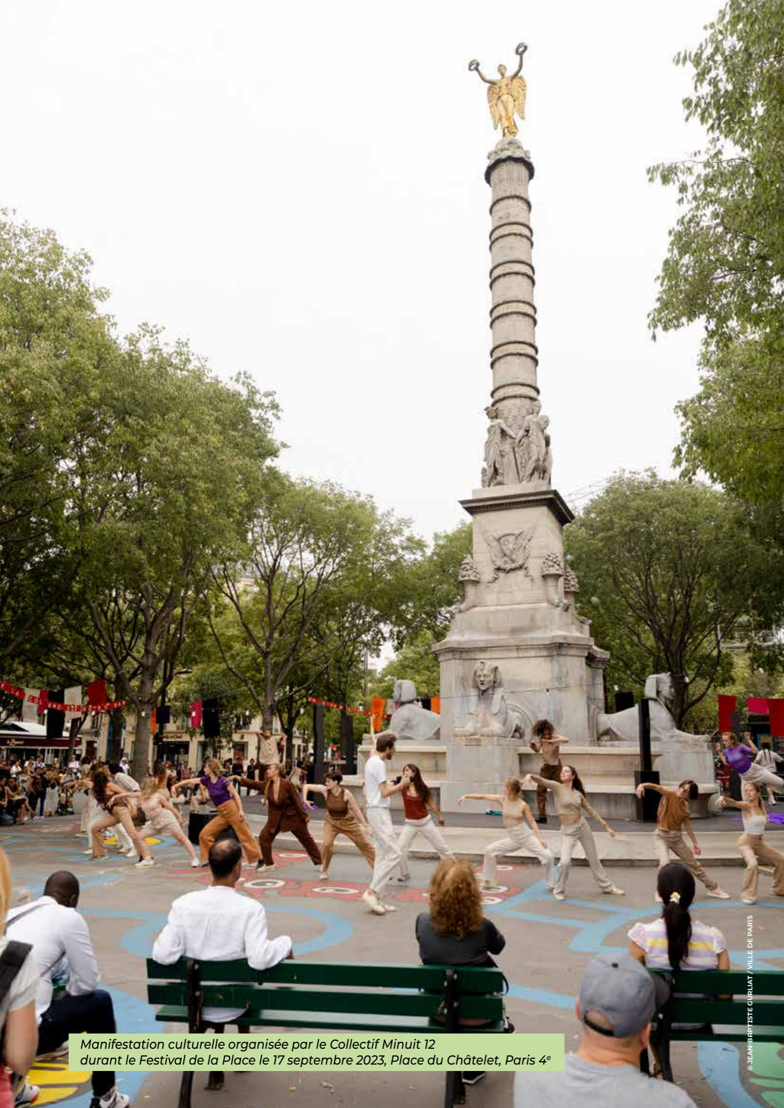
Manifestation culturelle organisée par le Collectif Minuit 12 durant le Festival de la Place le 17 septembre 2023, Place du Châtelet, Paris 4 e