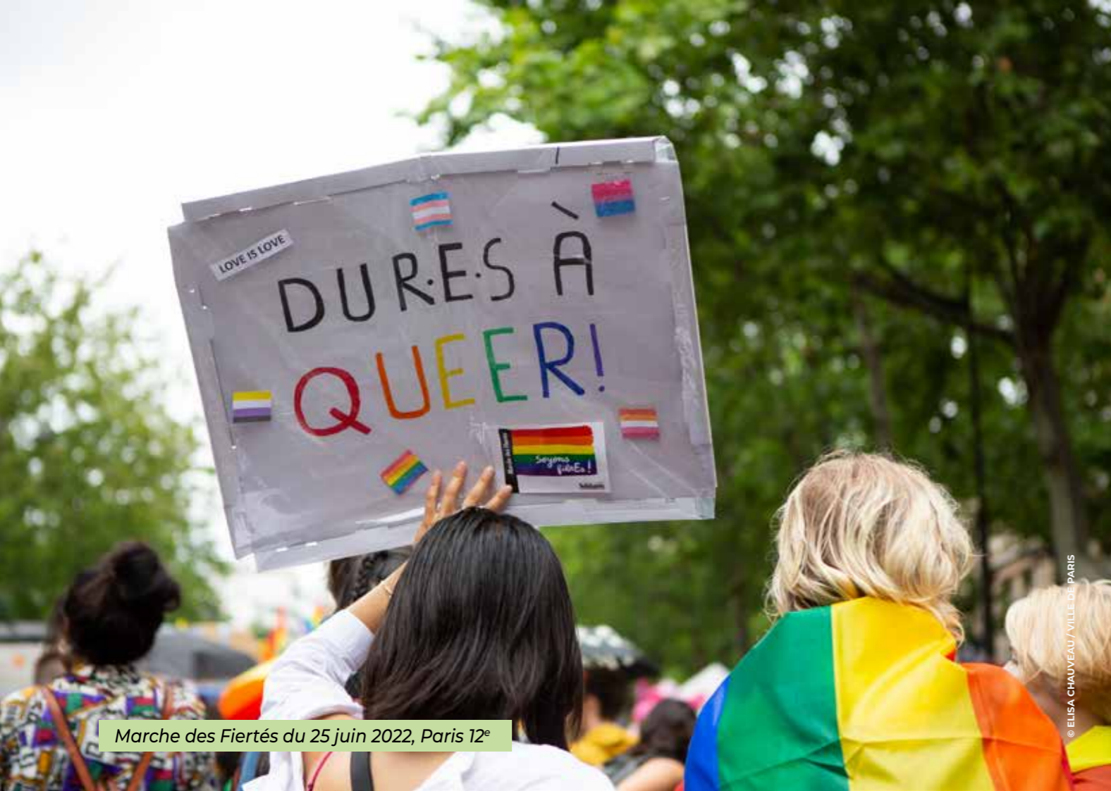
Marche des Fiertés du 25 juin 2022, Paris 12 e