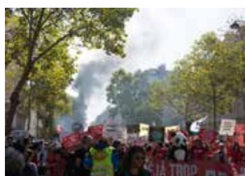
Marche pour le Climat du 21 septembre 2019, Bld Saint-Michel, Paris 5 e et 6 e