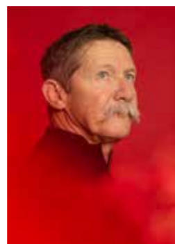
Portrait de Parisien