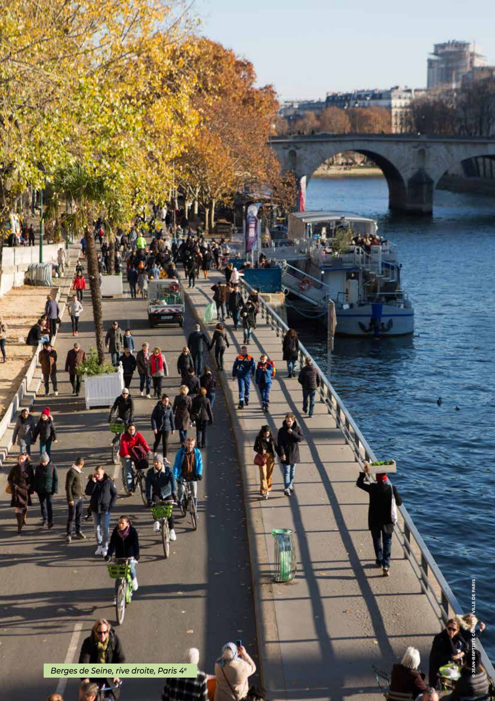
Berges de Seine, rive droite, Paris 4 e