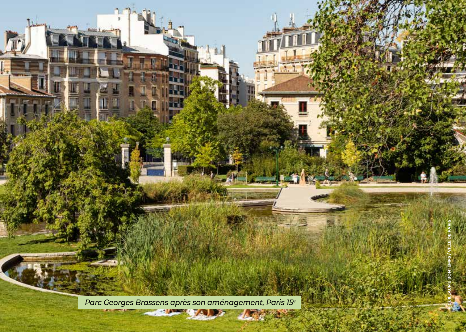
Parc Georges Brassens après son aménagement, Paris 15 e

Paris, ville jardin. Pour parvenir à cet objectif, 170 000 arbres auront été plantés en 2026, et 300 nouveaux hectares d'espaces verts seront ouverts au public en 2040. La ville devient plus accueillante, calme et respirable. Les nouveaux espaces de biodiversité accueillent de nouvelles plantes et de nouveaux animaux. Les friches industrielles sont rachetées afin d'être rendues à la nature, les rues se bordent d'arbres, le plan urbain est zébré de coulées vertes, les places et les trottoirs sont pris d'assaut par les gazons et les lierres tandis que de nouveaux parcs, véritables poumons verts dans la capitale, fendent le goudron pour offrir aux Parisiennes et aux Parisiens de nouvelles oasis de fraîcheur en plein cœur de la ville. Des forêts urbaines prennent racine (place de la Catalogne dans le 14 e , bois de Charonne dans le 20 e ), et la petite ceinture, patrimoine historique et naturel inestimable, est rendue aux Parisiens. Ces transformations, en plus de baisser la température de la ville, permettent d'absorber massivement le CO 2 en améliorant la qualité de l'air, ramènent une riche biodiversité dans Paris et offrent de nouveaux terrains de jeux aux apiculteurs et agriculteurs urbains !