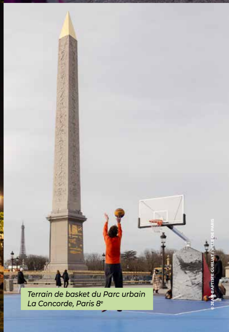
Terrain de basket du Parc urbain La Concorde, Paris 8 e