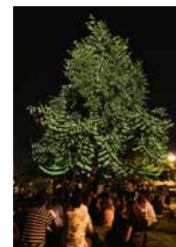
Rumba de Kitty Hart, Yétis Pop et fanfare Technobrass lors de la Nuit blanche du 3 juin 2023, Place de l'Hôtel de Ville, Paris 4 e