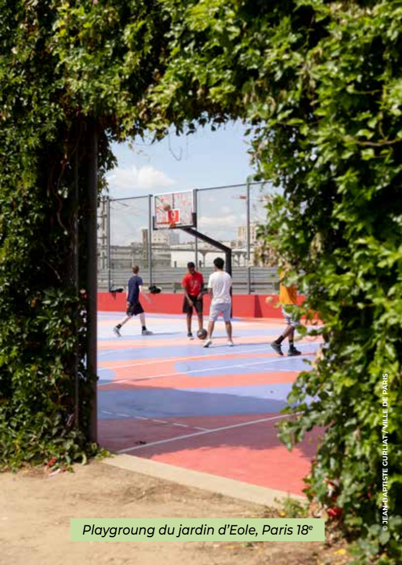
Playground du jardin d'Eole, Paris 18 e