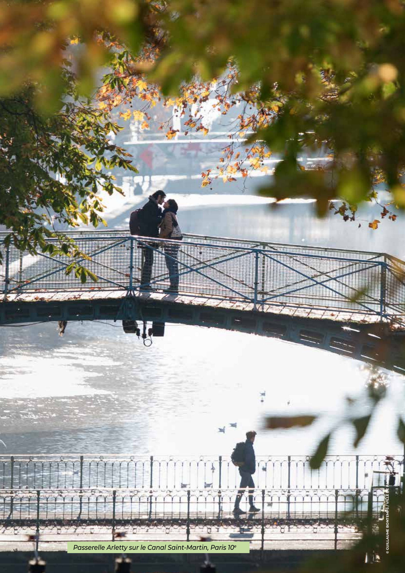
Passerelle Arletty sur le Canal Saint-Martin, Paris 10°