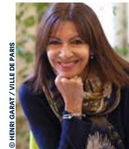
Anne HIDALGO Maire de Paris

Notre ville évolue et nous changeons avec elle. Ensemble, nous avons traversé tant de crises majeures, répondu aux nouveaux défis écologiques, solidaires et démocratiques, mais également connu des grands moments de rassemblement. Les Jeux Olympiques et Paralympiques ont accéléré les transformations de notre capitale.