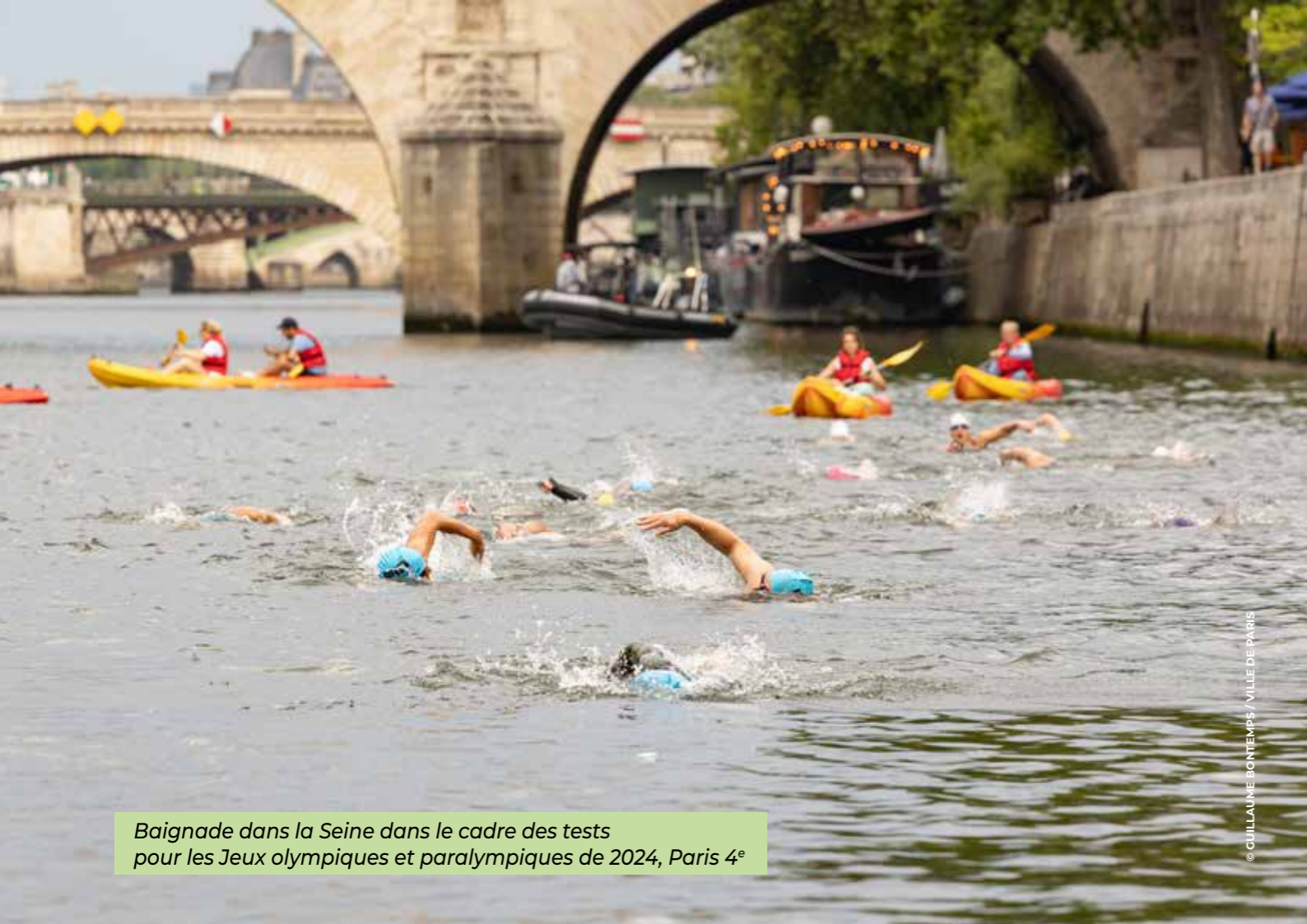
Baignade dans la Seine dans le cadre des tests pour les Jeux olympiques et paralympiques de 2024, Paris 4 e