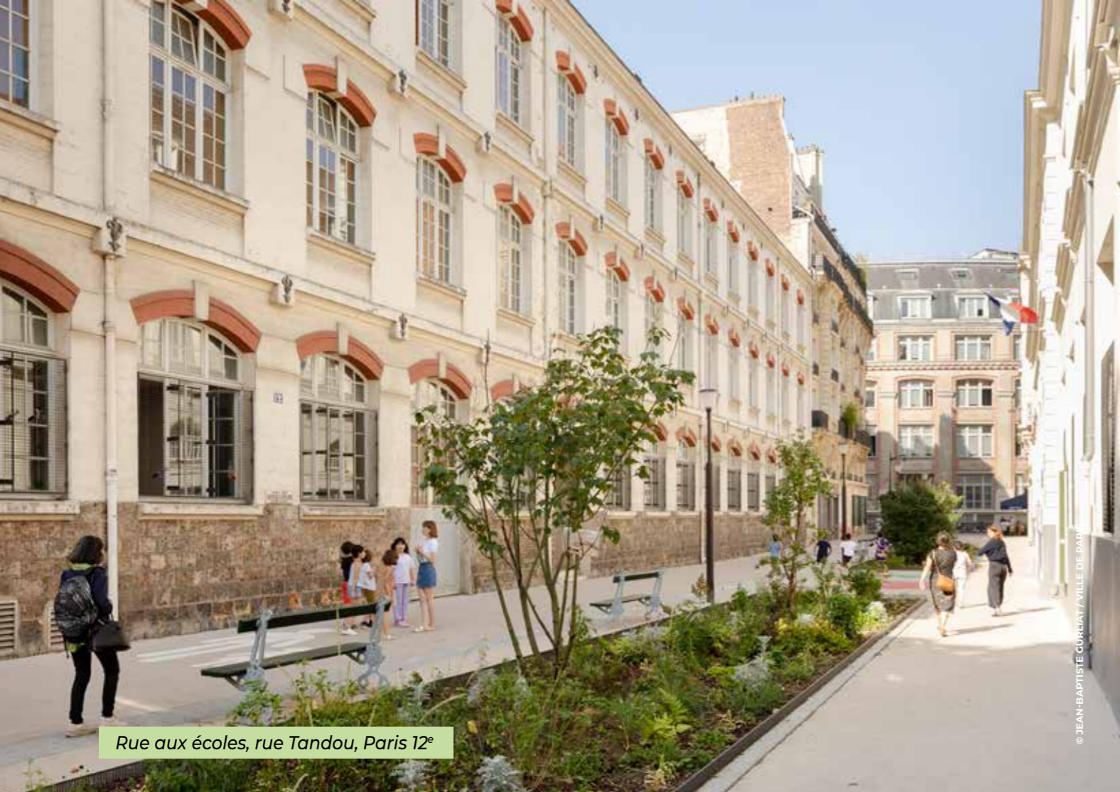
Rue aux écoles, rue Tandou, Paris 12 e