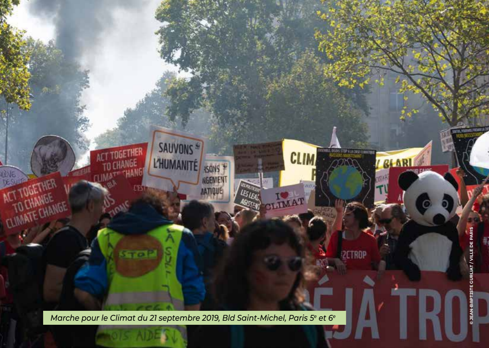
Marche pour le Climat du 21 septembre 2019, Bld Saint-Michel, Paris 5 e et 6 e